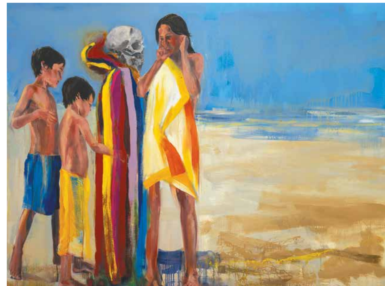
© Daniel Clarke – Adagp, Paris, 2023

Rayan Yasmineh – Cyrus et l'odeur du Lys devant les murs de Jérusalem – 2020 – Huile et émulsion sur panneau – Courtesy de l'artiste & mor charpentier, Paris. À voir au MO.CO. Panacée.