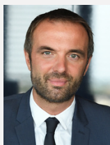
Michaël DELAFOSSE Maire de la Ville de Montpellier Président de Montpellier Méditerranée Métropole

Tous ces dispositifs participent à proposer des aides adaptées à chacun de nos publics et ainsi participer au développement d'une véritable filière du vélo sur le territoire.