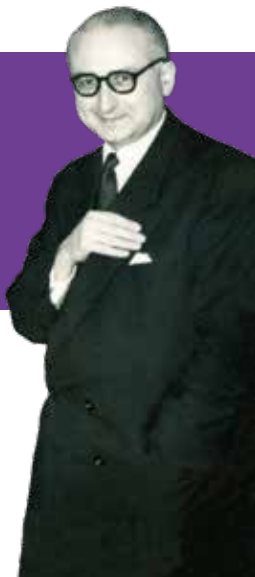
Edmond Charlot années 1950