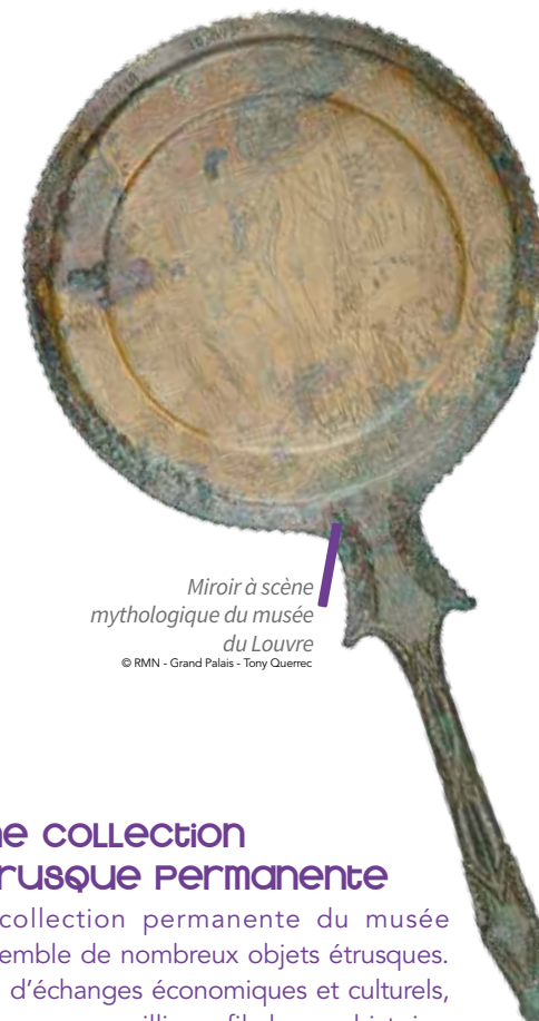
Miroir à scène mythologique du musée du Louvre