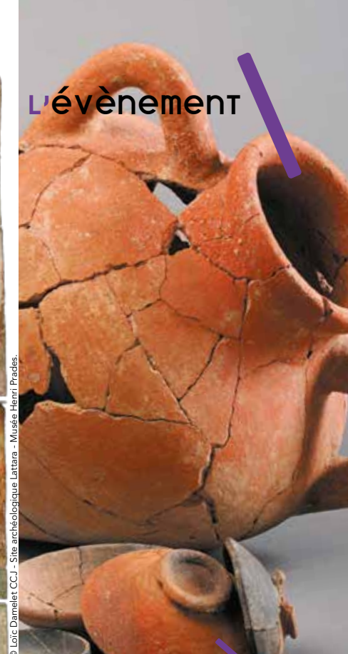
Amphores et céramiques provenant de la zone 27 de Lattara.