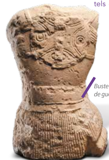
Buste d'une statue de guerrier de Lattara.