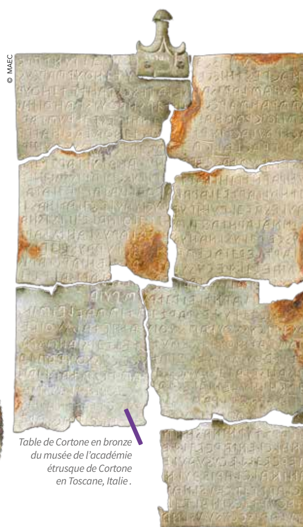
Table de Cortone en bronze du musée de l'académie étrusque de Cortone en Toscane, Italie.

La collection permanente du musée rassemble de nombreux objets étrusques. Lieu d'échanges économiques et culturels, Lattara a accueilli, au fil de son histoire, différents peuples de la Méditerranée tels que les Étrusques qui ont côtoyé les populations gauloises locales.