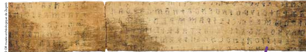
Liber Linteus : livre de lin du musée de Zagreb.