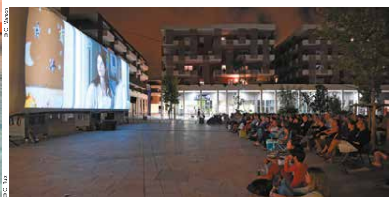
De gauche à droite : Des séances en plein air à la piscine Jean Vivès à Montpellier, dans les carrières de Sussargues et le quartier des Constellations à Juvignac.