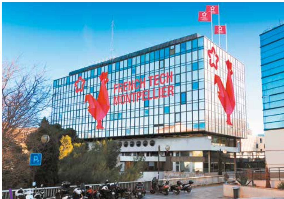
D'ici la fin de l'année, l'ancien hôtel de ville de Montpellier se mettra aux couleurs de la French Tech pour accueillir de nouvelles entreprises du secteur.

C'est officiel : l'État a retenu le Business & Innovation Center (BIC) de Montpellier Méditerranée Métropole comme incubateur partenaire du French Tech Ticket. Dès le 1 er janvier 2017, l'équipement accueillera des start-up étrangères dans ses locaux. Cette marque de confiance vient récompenser le savoir-faire du BIC et la dynamique de l'écosystème French Tech sur le territoire, qui ne s'est pas essouffée. En deux ans, le mouvement, auquel s'est associé la Métropole, a pris de l'envergure. Une marche en avant qui n'est pas prête de s'arrêter.