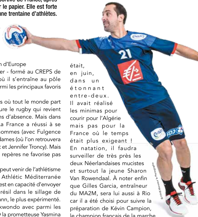
Déjà double champion olympique, Michaël Guigou tentera la passe de trois avec l'équipe de France de handball.