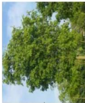
Calix australis , Microcoulier / Caduc