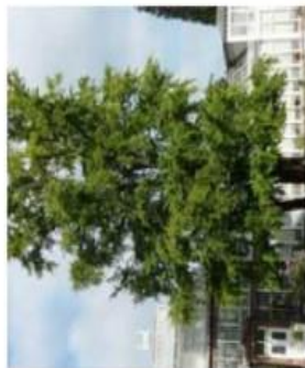
Ginkgo biloba / Arbres aux 40 écus / Caduc