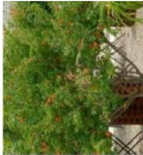
Punica granatum / Grenadier / Persistant