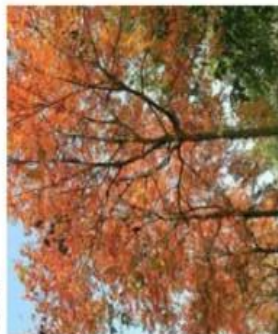
Koelreuteria paniculata / Sivoirier / Caduc