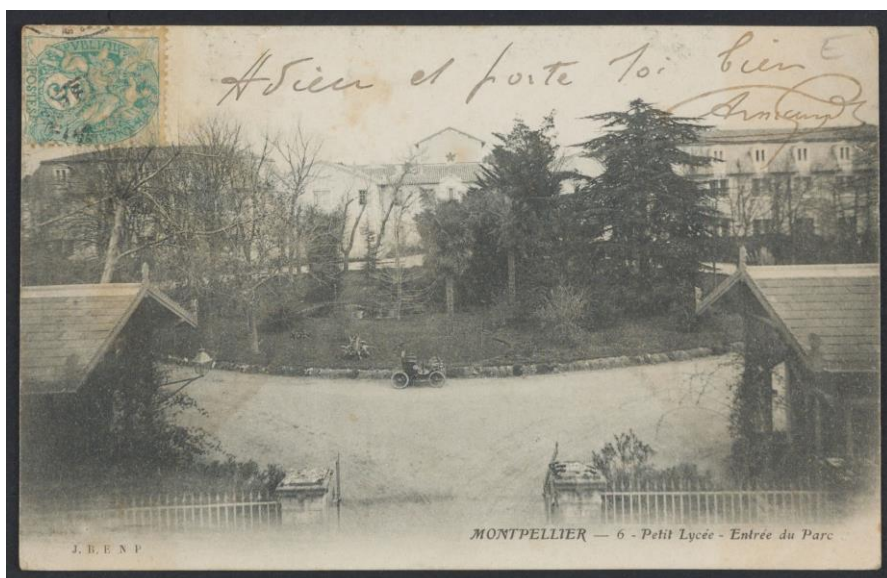
Archives Départementales de l'Hérault - 2FICP_02326_00001, vers 1900 – Entrée du Parc