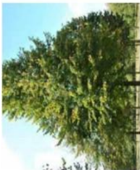
Tilia cordata , Tilleul à petites feuilles