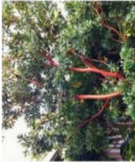
Albastus unedo « Marina » / Arbousier / Persistant