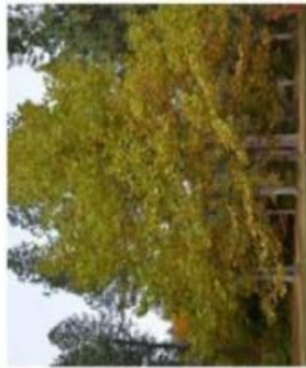
Platanus acerifolia , Platan à feuilles d'érables