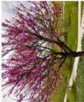
Cercis siliquastrum / Arbres de Judée / Caduc