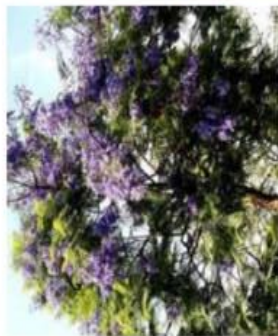
Jacaranda mimosiflora / Flamboyant bleu / Caduc