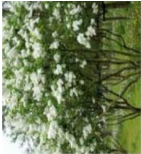
Syringa vulgaris / Lilas blanc / Feuillage caduc