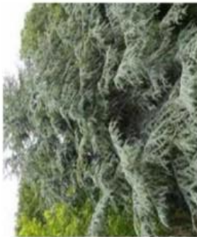
Cedrus atlantica , Cèdre de l'Atlas