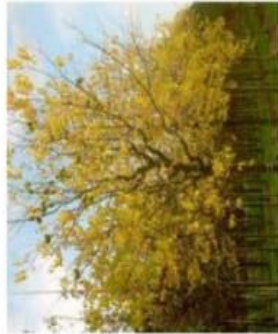
Mactera pomifera / Oranger des Osages / Caduc