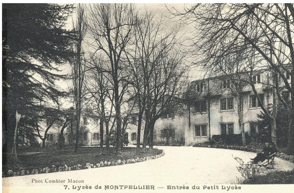
vers 1900 – Bâtiments du Petit Lycée depuis une allée du Parc

Le parc conserve aujourd'hui nombre des caractéristiques des parcs paysagers de la période de la deuxième moitié du XIXe siècle : allées courbes bordées de pierres, plantations à l'anglaise, bassins, pavillons et grilles d'entrée. Certains documents mentionnent également la présence de puits et de galeries souterraines. Le site conserve en outre une trace symbolique de son occupation par l'Armée avec la présence d'un mât de drapeau sur une bute en gradins, face à l'entrée du parc