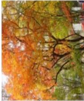
Acer monspessulanum / Erable de Montpellier / Caduc