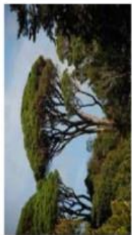
Pinus pinea / Pin parasol / Persistant