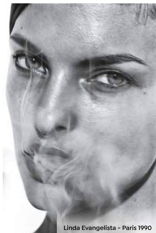
Linda Evangelista - Paris 1990