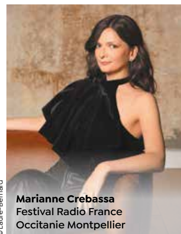
© Laure-Bernard Marianne Crebassa Festival Radio France Occitanie Montpellier