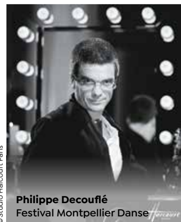
Philippe Decoufflé Festival Montpellier Danse