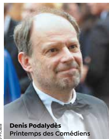
© Picasa Denis Podalydès Printemps des Comédiens

Scène ouverte à la création et aux artistes, Montpellier et sa métropole développent toute l'année une tradition d'accueil des plus grands noms du livre, du théâtre, de la danse, de la musique, du cinéma, des arts plastiques... Au fil des saisons, des festivals, ces rencontres et ces échanges modèlent et nourrissent l'ensemble de la scène locale, assurant ainsi un double rôle : d'inspiration et de rayonnement.