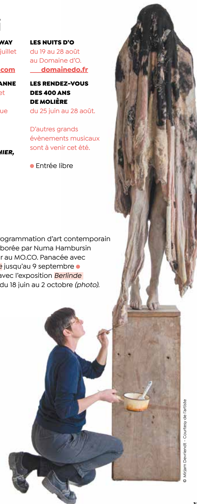
© Mirjam Devriendt - Courtesy de l'artiste