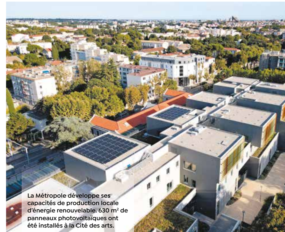
La Métropole développe ses capacités de production locale d'énergie renouvelable. 630 m² de panneaux photovoltaïques ont été installés à la Cité des arts.