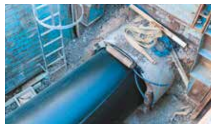
Gros plan sur la technique de tubage. Le nouveau feeder est inséré dans l'ancien.

Mars : fin des travaux préparatoires engagés depuis 2020 Dernier trimestre 2022 : lancement des travaux de voirie.