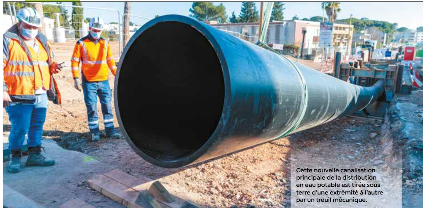
Cette nouvelle canalisation principale de la distribution en eau potable est tirée sous terre d'une extrémité à l'autre par un treuil mécanique.