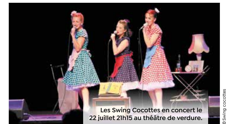
Les Swing Cocottes en concert le 22 juillet 21h15 au théâtre de verdure.