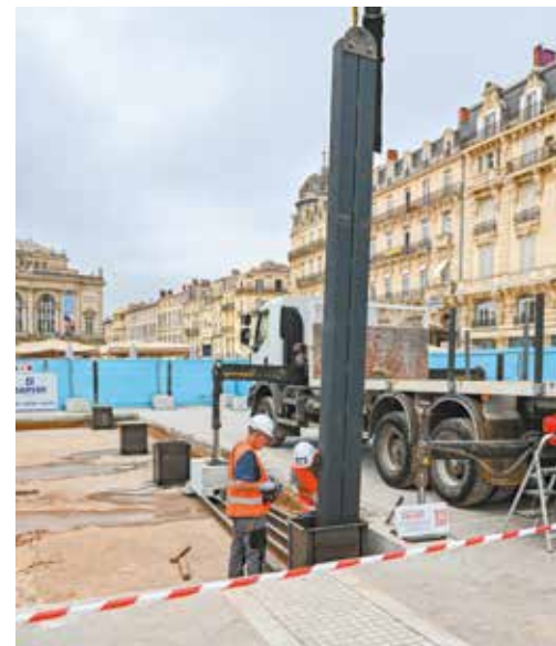
Un chantier spectaculaire : les poteaux de 8 m de haut ont été installés avec une grue télescopique et reposent sur les fondations au niveau - 4 du parking.

de la Comédie au nouveau fonctionnement du parking. Une nouvelle phase de travaux importante interviendra en 2023, avec le début des travaux de rénovation et d'embellissement de l'Esplanade.