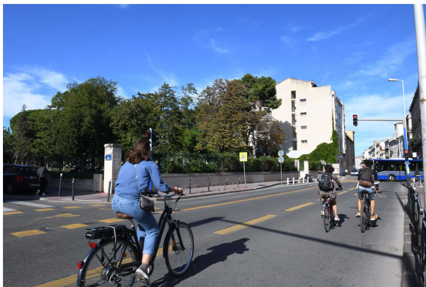
Cyclistes quartier Clémenceau