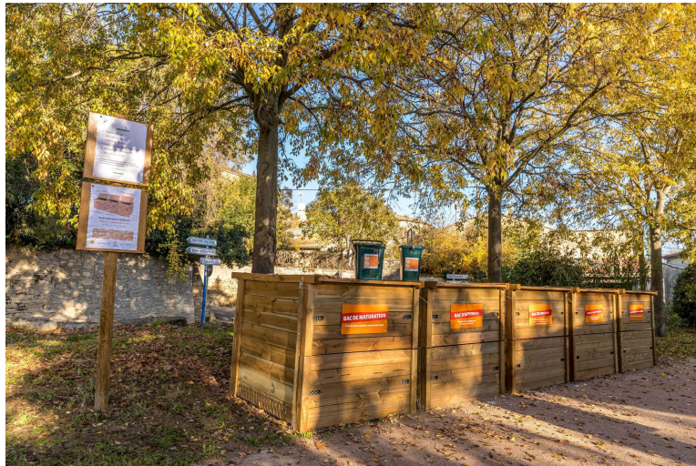
Composteurs collectifs à Saussan