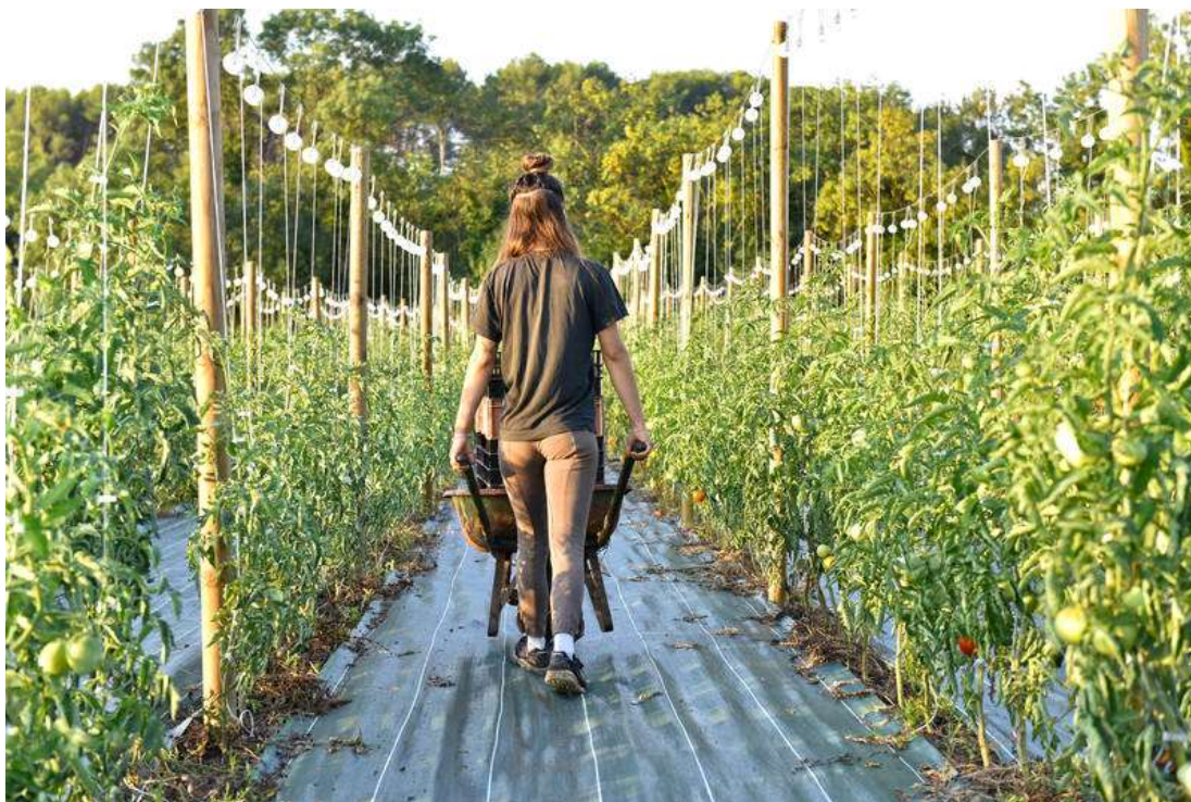
Domaine de Viviers – Jacou