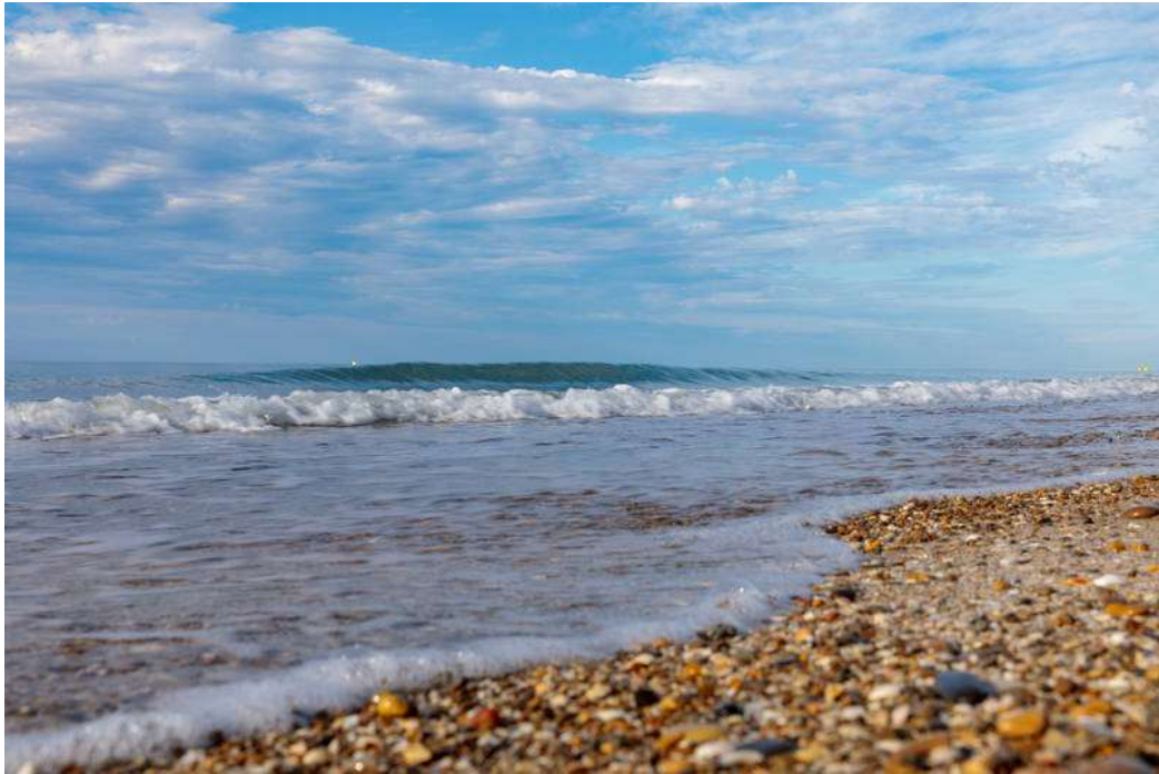
Plage du pilou – Villeneuve-lès-Maguelone