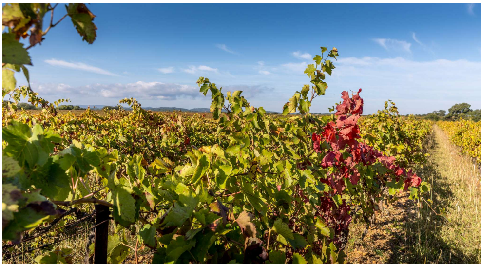
Paysage de vignoble au Château de Fourques, à Juvignac, au cœur de la Métropole