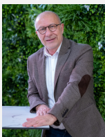
Alain BARBE Président de la Communauté de communes du Grand Pic Saint-Loup

Cet aménagement cyclable sera en effet utile et répond à un réel besoin pour les déplacements domicile-travail comme pour les déplacements liés aux loisirs ou au tourisme. De toute évidence, cet itinéraire sera très fréquenté, tant il est attendu par les habitants du Sud du territoire du pic Saint Loup qui souhaitent se rendre vers la Métropole à vélo comme par les montpelliérains qui souhaitent venir profiter de la beauté de notre territoire.