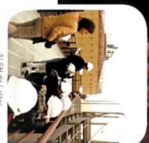
ALSH de Latres

L'APIEU a mis en œuvre deux méthodes d'évaluation différenciées selon le type de public, afin de saisir le ressenti des visiteurs après l'animation. Pour le public scolaire, le questionnaire prenait la forme d'un barème sous forme d'échelle avec plusieurs catégories (contenu pédagogique, enchaînement des séquences, adaptation au public, qualité des outils pédagogiques, intérêt du public, réponses à vos attentes, technique d'animation, connaissances acquises) que le répondant pouvait classer de très satisfait à très insatisfait. Pour le grand public, l'évaluation se déclinait en questions semi-directives sur les mêmes thématiques.