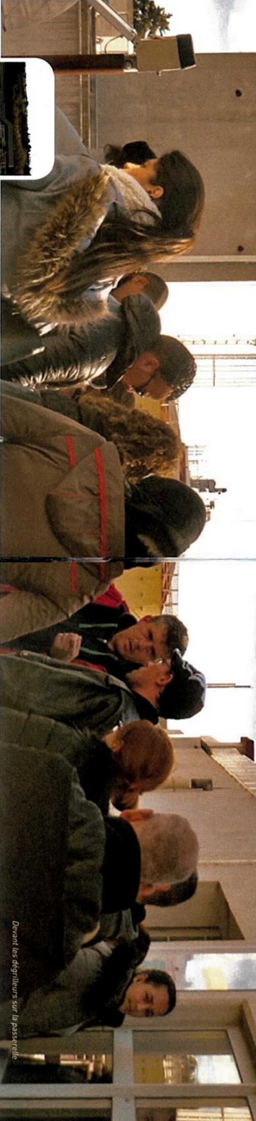
Devant les dégrilleurs sur la passerelle