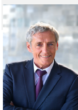
Philippe Saurel Maire de Montpellier Président de Montpellier Méditerranée Métropole

Montpellier Méditerranée Métropole s'est engagée depuis de nombreuses années dans une démarche de prévention et de réduction des déchets. La simplification du tri pour les 450 000 habitants du territoire fait partie intégrante de cette politique. Grâce à notre partenariat avec Citeo et aux travaux de modernisation du centre Demeter, nous sommes désormais en mesure de trier tous les emballages en plastique mais aussi les petits emballages en acier et aluminium, dans le but de les recycler et de les valoriser. Un grand pas pour la Métropole de Montpellier mais surtout pour la préservation de notre environnement.