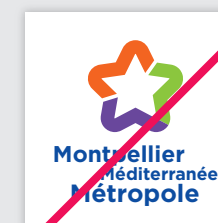
Modification des typographies