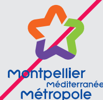
Suppression du cadre blanc et de l'ombre