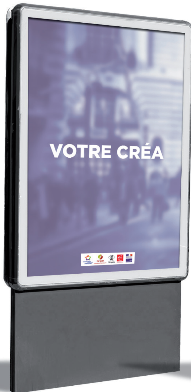
Logo utilisé en quadri