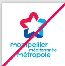
Modification des couleurs