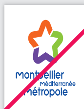
Déformation des éléments