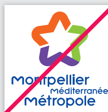
Modification des proportions