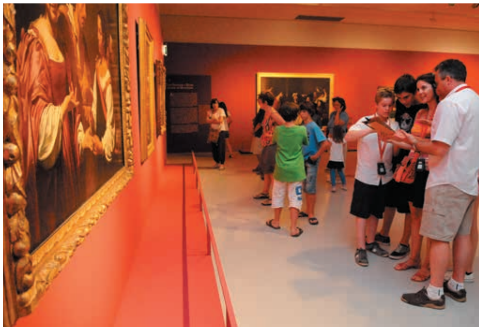
Des forfaits famille existent dans de nombreux équipements de l'Agglomération comme le musée Fabre.

consacré en 2012 par Montpellier Agglomération aux tarifs sociaux dans les transports.