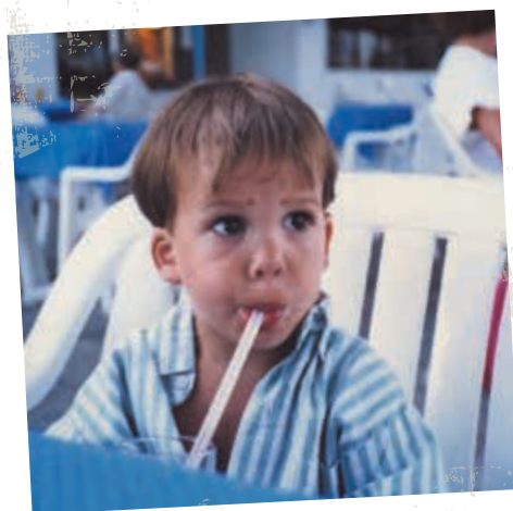
Artus // humoriste Né le 17 août 1987 au Chesnay (78)