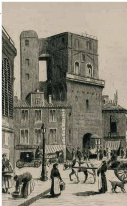
Au début du XX e siècle, la place de l'Observatoire et les rues adjacentes étaient déjà des artères commerçantes, où l'on trouvait de nombreux magasins de tissus, de perles et d'instruments de musique.