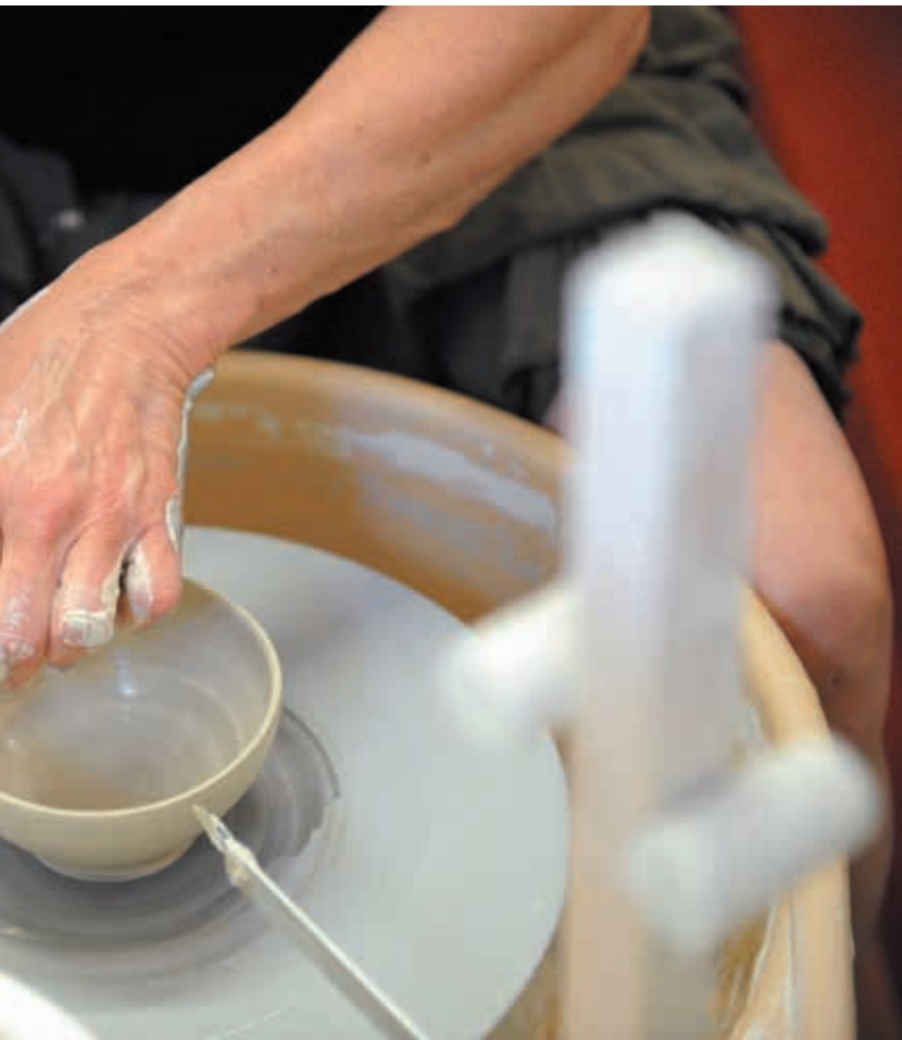
Le travail de la céramique est l'un des métiers d'art les plus vieux au monde et demande une grande dextérité manuelle.