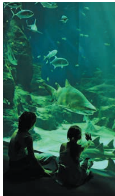
Le bassin Océan, héberge notamment les impressionnants prédateurs que sont les requins.

À Mare Nostrum, il n'y a rien d'impossible : embarquer avec les soigneurs-scapandriers pour une plongée virtuelle au milieu des raies guitares et des bancs de poissons dans le Théâtre de l'Océan, assister en direct à une séance d'entraînement des manchots du Cap dans le nouvel espace « Escale en Afrique du Sud » ou observer le nourrissage des impressionnants requins dans le bassin Océan. Chaque jour, l'aquarium propose un programme complet d'animations, toutes plus captivantes les unes que les autres. L'occasion d'assister en direct à des démonstrations inédites et d'en apprendre davantage sur les espèces présentes.