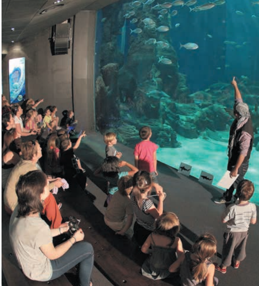
Des animateurs sont présents aux quatre coins de l'aquarium pour répondre aux questions des visiteurs.

c'est le nombre de visiteurs que l'aquarium Mare Nostrum a accueilli l'an dernier. L'établissement est le site touristique payant le plus visité en Languedoc-Roussillon.