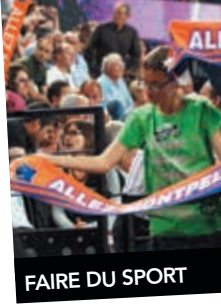
FAIRE DU SPORT