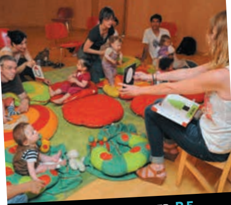
LIRE, APPRENDRE ET S'AMUSER P.5