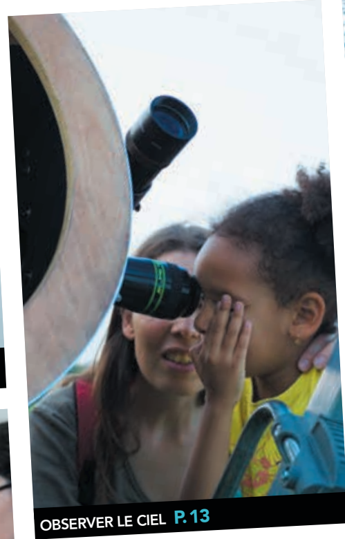
OBSERVER LE CIEL P.13