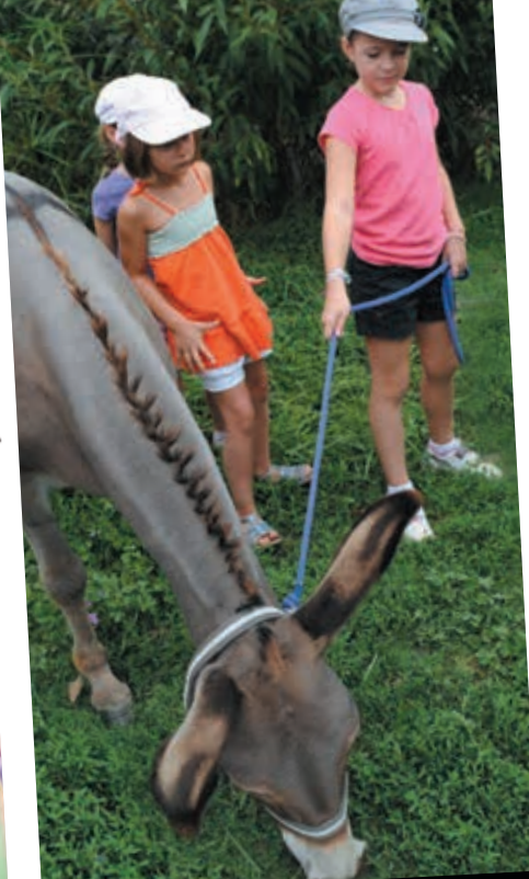
S'ÉDUIQUER À L'ENVIRONNEMENT P.21