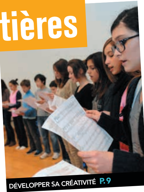
DÉVELOPPER SA CRÉATIVITÉ P.9