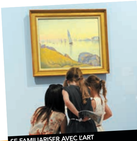
SE FAMILIARISER AVEC L'ART ET L'ARCHÉOLOGIE P.7