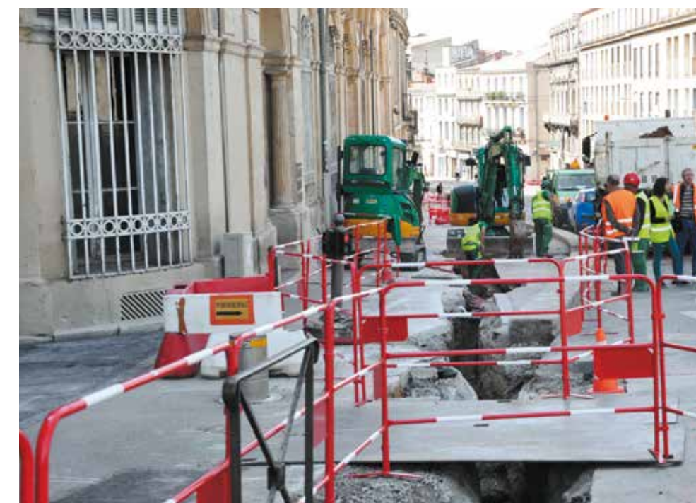
Les travaux de déplacement des réseaux ont débuté sur le tracé de la ligne 4.