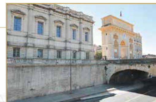
Le passage de la ligne 4 se fera sur la partie basse du site classé du Peyrou, par le boulevard du P r Louis Vialleton (le pont du même nom sera également rénové pendant les travaux du tramway). Deux ascenseurs habillés de verre et un escalier permettront d'accéder directement à l'Arc de Triomphe, entrée symbolique du centre historique qui ouvre sur l'avenue Foch et ses commerces.