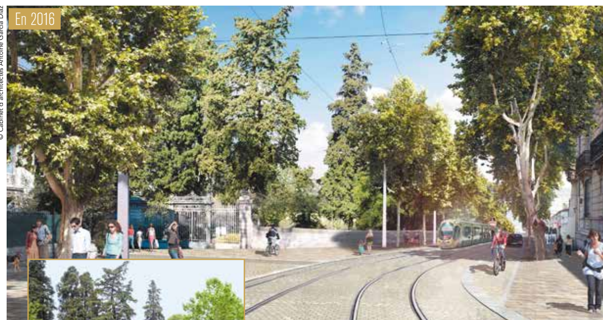
Le boulevard Henri IV et sa Tour des Pins, une des 25 tours de l'enceinte fortifiée qui protégeait la ville de Montpellier entre le XII e et XIII e siècles, fait le lien entre le Jardin des Plantes et le Peyrou. Le double alignement de platanes structure l'ensemble et cadre la plateforme de tramway bordée de vastes espaces de déambulation.