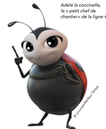
Adèle la coccinelle, le « petit chef de chantier » de la ligne 4

Un journal sur le chantier et des tracts réguliers sur les modifications de circulation seront distribués. Des réunions d'informations se tiendront avec les commerçants. Un agent sera présent sur le terrain. Un local Info tramway sera ouvert à tous sur le boulevard du Jeu de Paume et un numéro de téléphone dédié a été mis en place pour répondre à toutes les questions des habitants de l'agglomération.