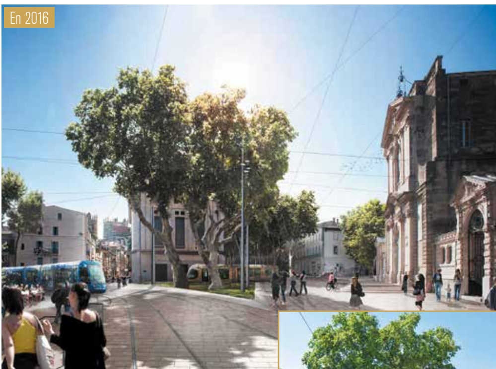
En bas du boulevard Henri IV, la ligne 4 rejoint les voies de la ligne 1 place Albert 1 er . L'identité de la place, habillée en dalles de pierre, est maintenue. Rénovée, elle sera porteuse, autour du parvis de la chapelle Saint-Charles, d'attractivité.