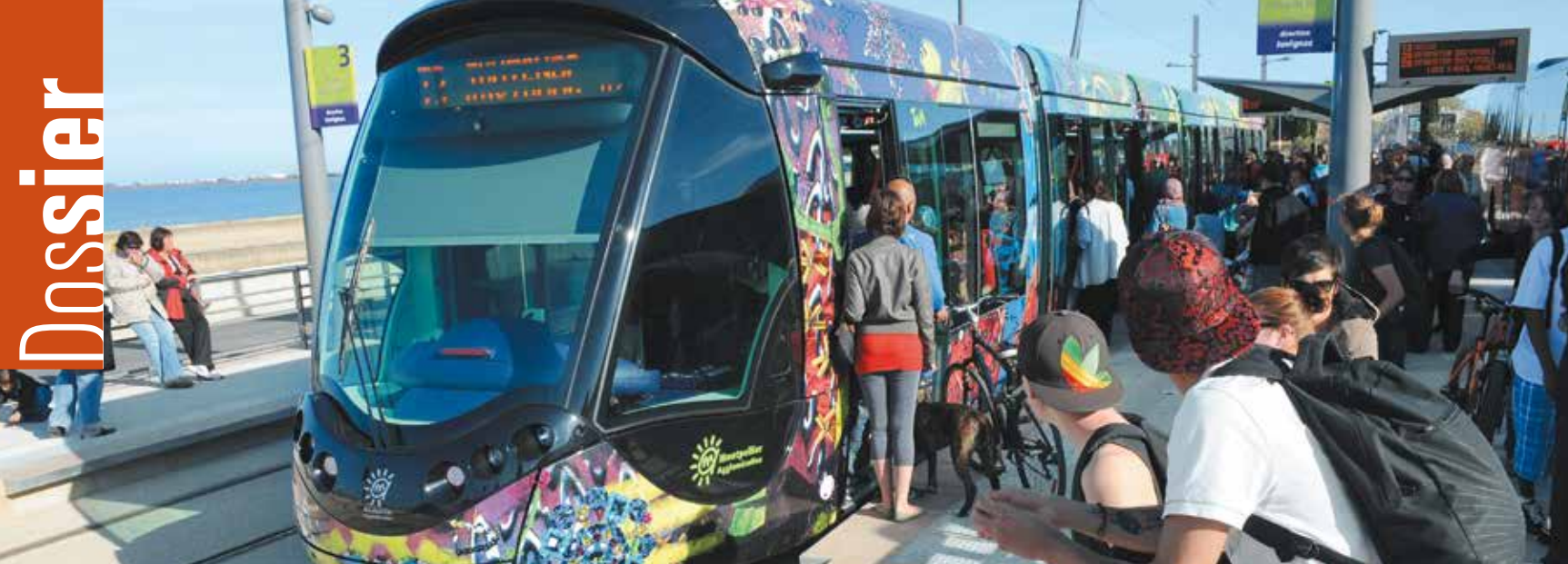
La ligne 3 jusqu'à la mer. Ce projet sera à l'ordre du jour du Conseil d'Agglomération extraordinaire du 13 juin.