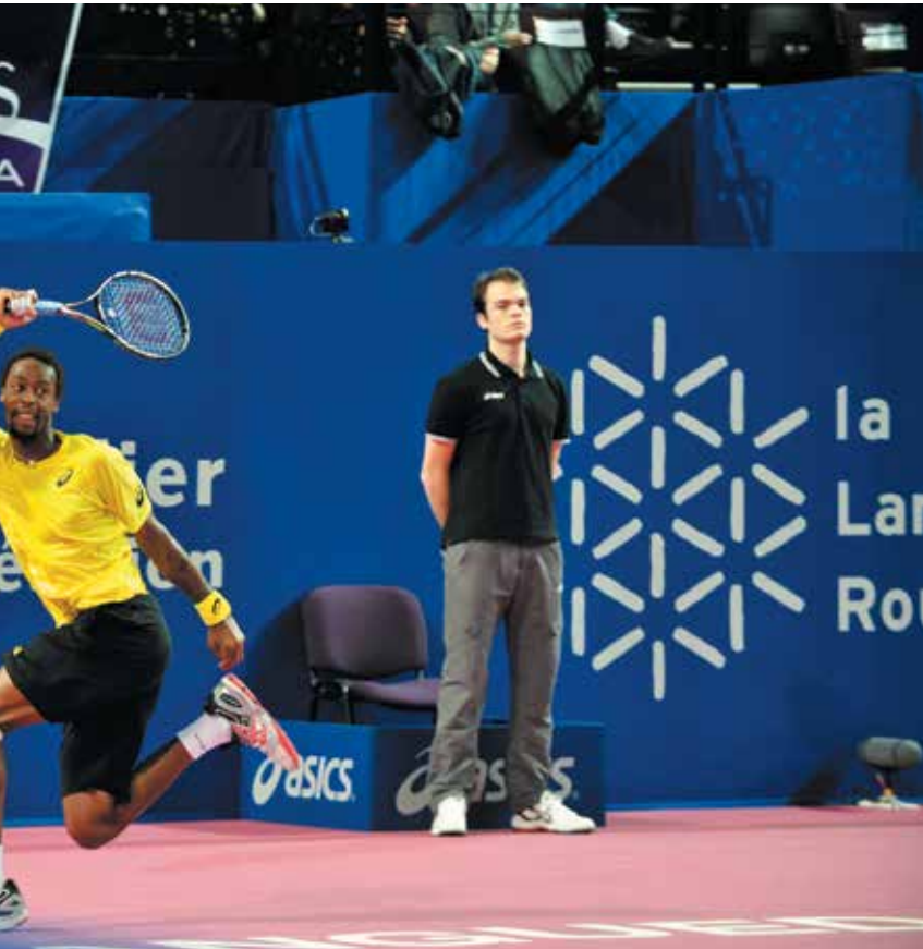
Gaël Monfils a déjà remporté deux fois l'Open Sud de France à Montpellier.