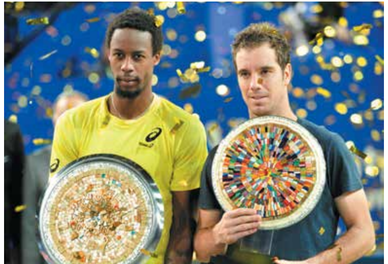
Les deux finalistes sortants figureront parmi les principaux favoris.