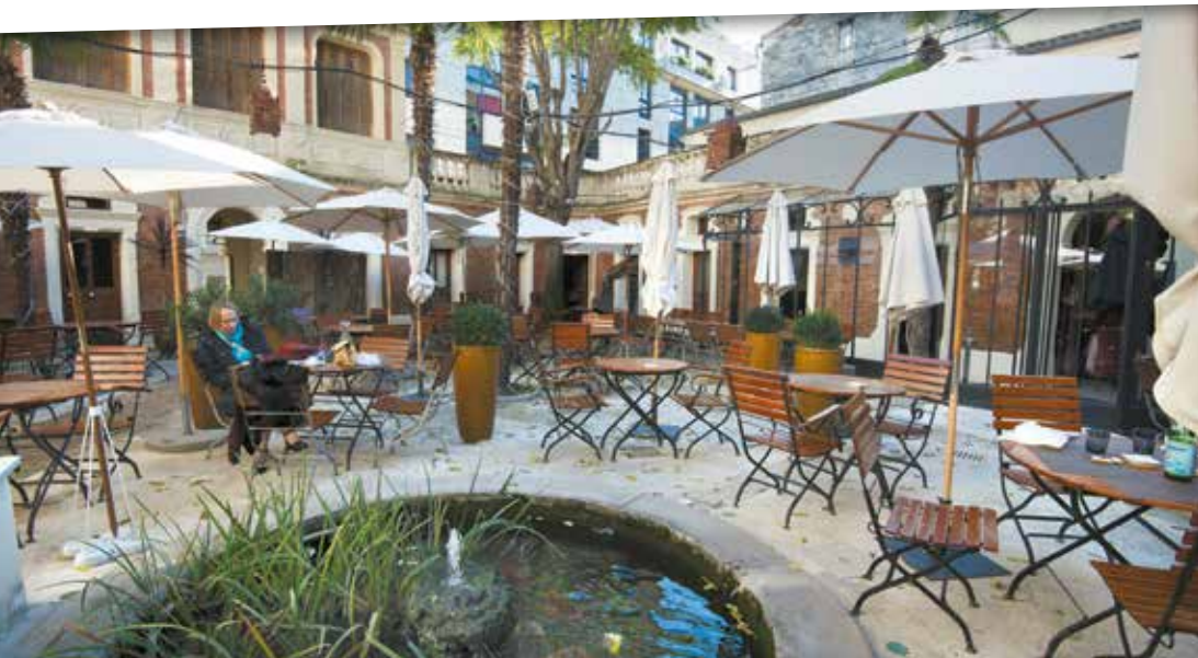
J'ai retrouvé aux Bains l'architecture arabe des riads que me faisait découvrir mon oncle du côté de Fès. Des bâtiments fermés de l'extérieur, mais à l'intérieur, la porte s'ouvre sur une ambiance méditerranéenne incroyable.

“ Nous avons aujourd'hui un désir fort d'exposer dans la ville où nous vivons et travaillons, de participer. La danse, la musique ont été promues à Montpellier, à travers notamment leurs festivals internationaux.