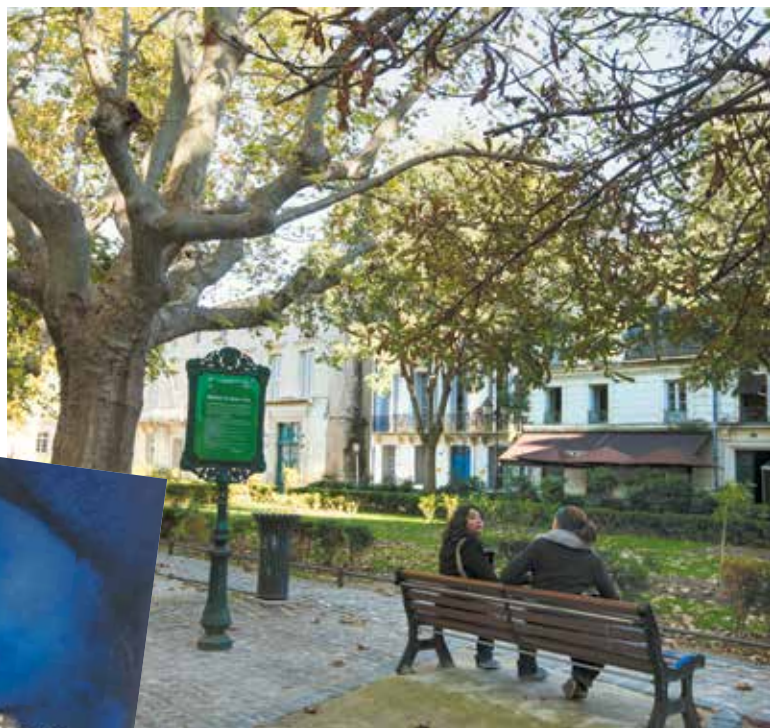
J'ai particulièrement apprécié l'exposition Odilon Redon au musée Fabre. Je partage son univers.