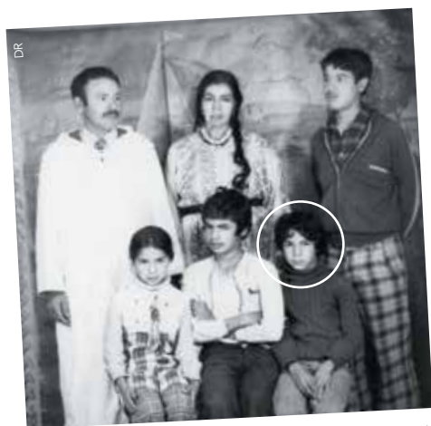
Mohamed Lekleti /// Artiste Né le 31 décembre 1965 à Taza au Maroc

“ C’est un luxe de vivre de mes œuvres ”