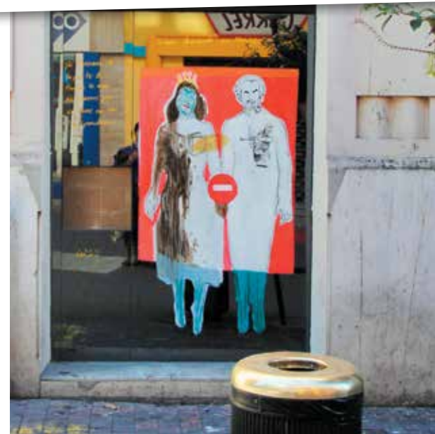
Avec mes œuvres éphémères, la rue devient un atelier à ciel ouvert. Comme ici à Sète, une ville que j'admire pour son effervescence culturelle.