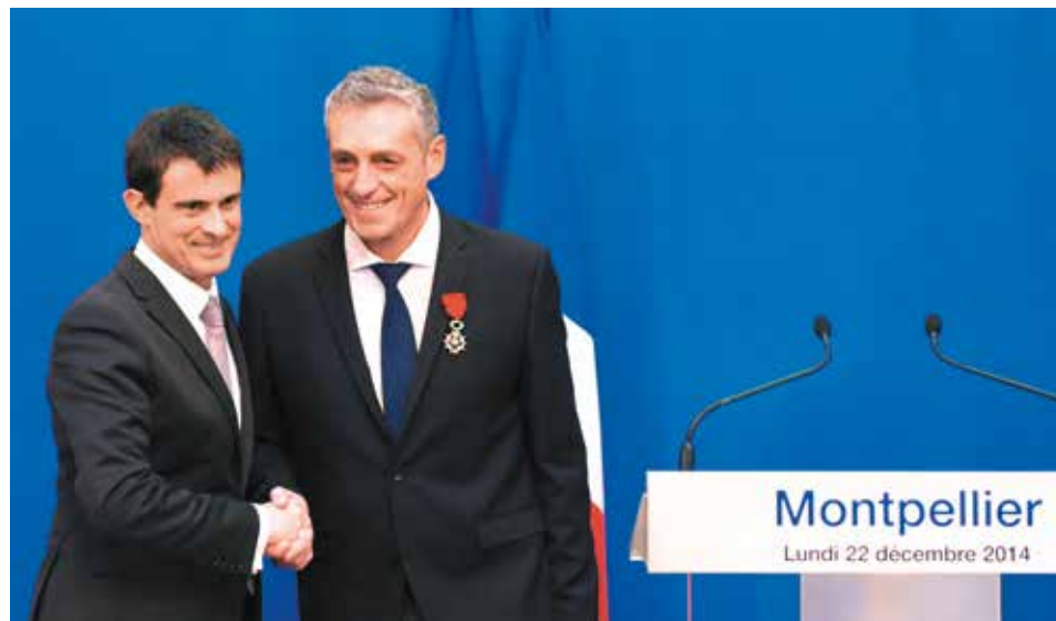
Montpellier Lundi 22 décembre 2014