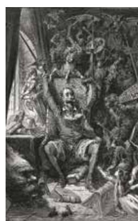
Pour l'ensemble des visuels © DR