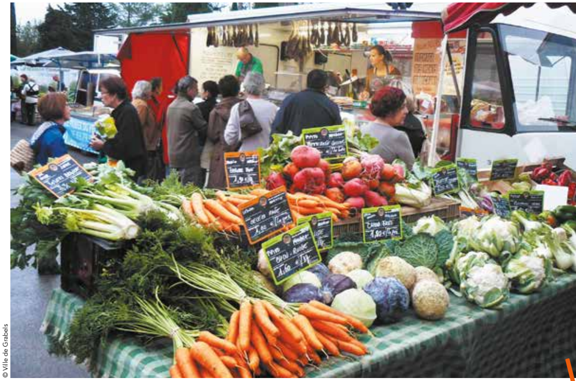
Tous les samedis matin au centre-ville et tous les mercredis matin à la Valsière, le marché des circuits-courts a aussi quelques éditions exceptionnelles avec encore un plus grand nombre d'exposants. À repérer dans l'agenda du MMMag !

Étape du chemin de Saint Jacques de Compostelle, entre Montarnaud et Montpellier, la Ville de Grabels a ouvert son jardin du presbytère,