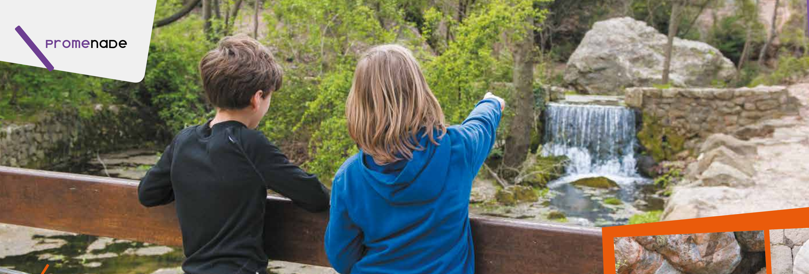
Aménagée par la Ville de Grabels, avec des tables de pique-nique, des bancs et des jeux pour enfants, la source de l'Avy est une oasis de fraîcheur en été.