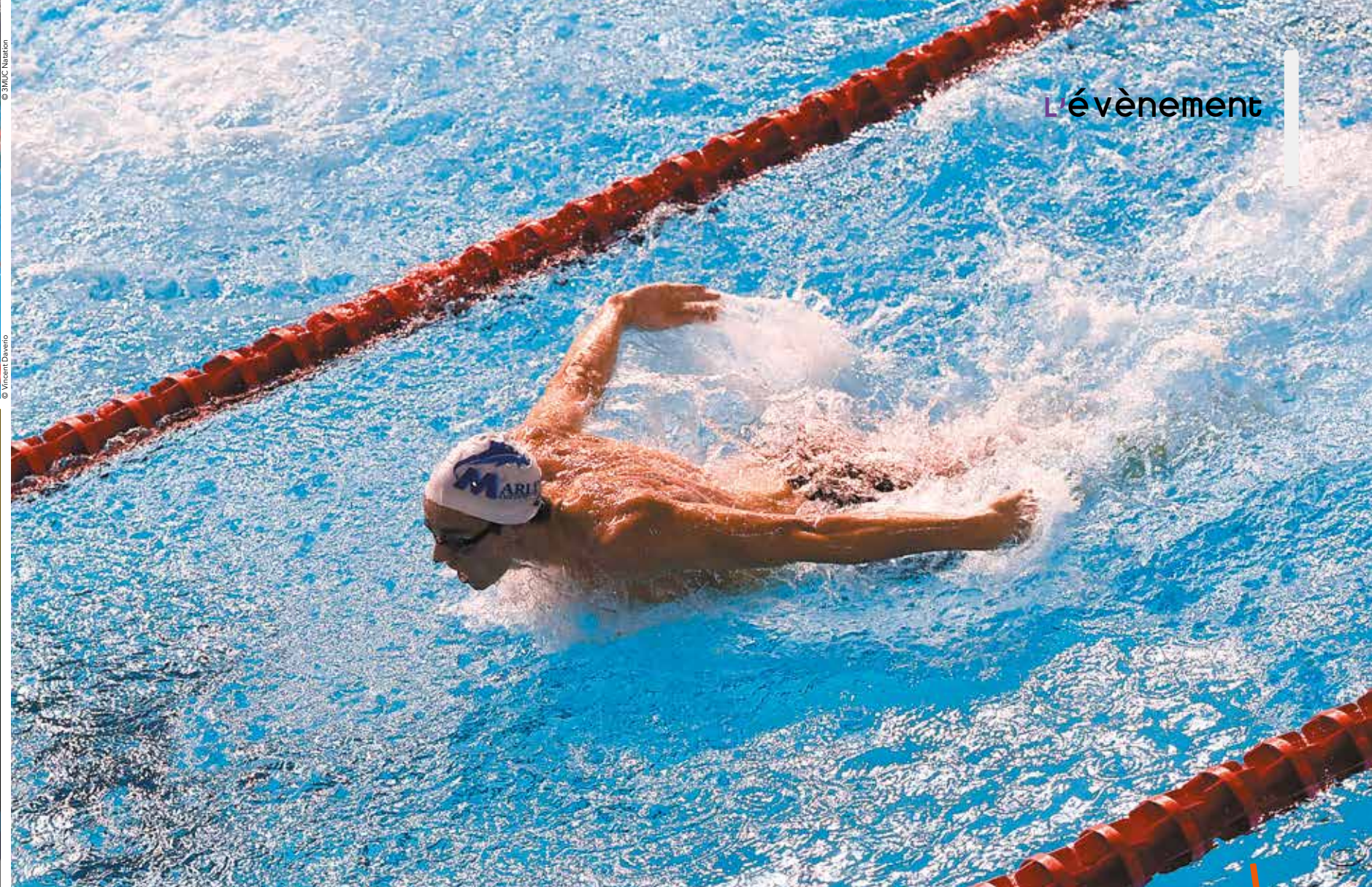
de monde du 100 mètres nage libre et devenait le premier nageur de l'histoire à passer sous la barre des 47 secondes. 2 Comme il y a sept ans, la piscine olympique d'Antigone est prête à vibrer pour de nouveaux exploits. 3 Plus d'une vingtaine de Marlins du 3MUC Natation sont engagés avec de réelles chances pour certains d'aller aux JO.