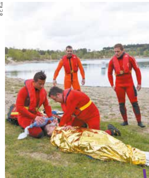
L'opération a été lancée le 13 avril au lac du Crès.

Les enfants comme les parents sont bienvenus dans les ateliers animés par les maîtres-nageurs des treize piscines de la Métropole, pour les sensibiliser aux dangers de la baignade, première cause de mortalité en été dans l'Hérault. Tout au long du mois de mai et jusqu'au 12 juin, dans le cadre de l'opération prévention des noyades, ils pourront participer à des animations ludiques et pédagogiques, avec tests anti-paniques, initiations aux premiers secours, à la profondeur... Chaque piscine propose également un jeu, avec 200 places à gagner, pour assister à un spectacle pédagogique, le 8 juin à la médiathèque Émile Zola. Ceux qui préfèrent la mer pourront retrouver l'opération sur le littoral, du 13 au 15 mai, pendant le festival international du kitesurf, le Festikite, à Villeneuve-lès-Maguelone, avec des animations, des ateliers ouverts à tous et des démonstrations. Cette année, les parents seront aussi invités à des conférences dans les écoles, le 10 mai à Saint Jean de Védas, le 24 mai au Crès, le 31 mai à Montpellier (Croix-d'Argent) et le 7 juin à Montpellier (Malbosq).