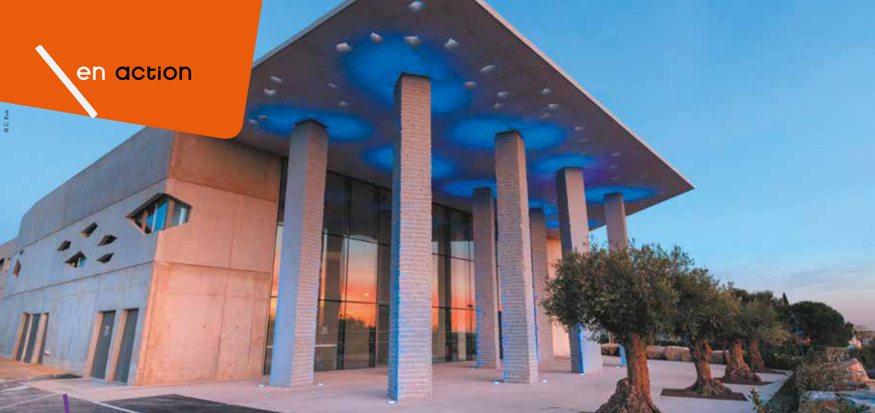
Inaugurée le 14 janvier prochain au Crès, l'Agora offre un nouvel écrin à la culture dans la métropole.