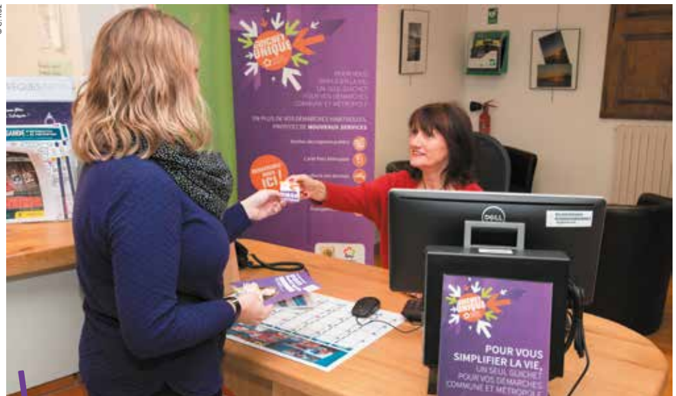
Dans chaque mairie, un guichet unique renseigne les usagers sur les services municipaux et métropolitains.

Depuis un an, un employé communal et un agent de la Métropole travaillent ensemble au guichet unique installé au rez-de-chaussée de la mairie de Fabrègues. Ils accueillent, renseignent et orientent au mieux les habitants. Dès l'ouverture, la première demande ne se fait pas attendre : une Fabrègquoise prend rendez-vous pour le ramassage d'encombrants à son domicile. Les sollicitations se succèdent ainsi tout au long de la journée, sur des compétences propres à la mairie, comme la réservation d'une place au sein de la crèche ou des formalités d'état civil, mais également dans des domaines où la Métropole est compétente : une demande de réparation d'un trottoir, le retrait d'un Pass Métropole, un problème de collecte des ordures ménagères, des informations sur les horaires de bus TaM... « Le guichet unique est une excellente chose. Il s'agit d'un véritable service public de proximité qui facilite les démarches administratives , assure Jacques Martinier, maire de Fabrègues. Auparavant, pour bénéficier des services métropolitains, les habitants se déplaçaient jusqu'à la maison d'Agglomération la plus proche, située à Villeneuve-lès-Maguelone... Aujourd'hui, ils bénéficient des mêmes services dans leur mairie. » Un meilleur suivi des demandes est également possible.