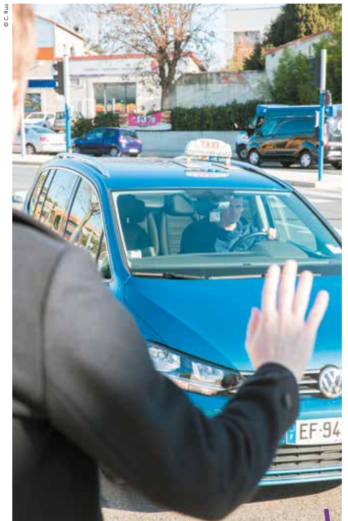
Plus de 200 conducteurs de taxis exercent dans la métropole et transportent leurs clients aux quatre coins du territoire.

Face aux formes de concurrence émergentes, qui ne sont pas soumises aux mêmes règles, des solutions existent pour les chauffeurs de taxis. Plusieurs applications, comme Le.Taxi (téléchargeable sur toutes les plateformes) mise en place par l'État et lancée pour la première fois à Montpellier, ont fait leur apparition. Elles proposent aux taxis d'être géolocalisés, permettant ainsi aux clients de les visualiser en temps réel depuis leur smartphone et de commander une course à distance. « Même si la concurrence est moins forte ici qu'à Paris ou Lyon, cette application est très utile, poursuit Arnaud Frutos. Les chauffeurs sont plus réactifs, ils gagnent du temps et leurs clients également » tout en regrettant « la multiplicité de ces plateformes qui provoque un morcellement de la demande. » Une solution pratique cependant, qui simplifie la vie des conducteurs l'utilisant et celle de leurs clients !