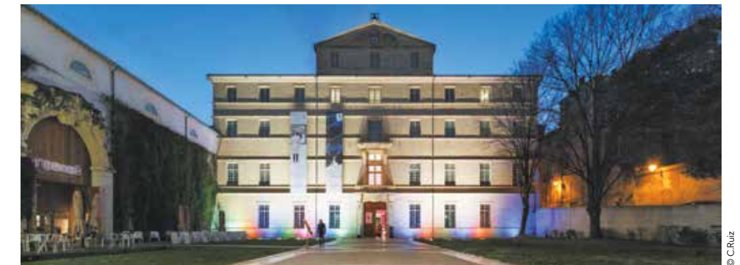
La rénovation du musée de 2003 à 2007 a été réalisée par l'architecte Emmanuel Nebout, avec la contribution de Buren pour le parvis et de Pierre Soulages, qui a donné au musée vingt de ses toiles, à cette occasion.