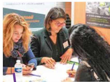
Deux journées consacrées aux demandeurs d'emploi.

Parc des Expositions (Pérois) de 9h à 18h Entrée libre