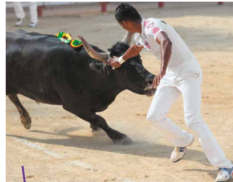
Onze courses camarguaises sont au programme du Trophée Taurin 2017.

Raseteurs, manadiers et clubs taurins sont dans les starting-blocks. Après deux premières éditions couronnées de succès, le Trophée Taurin Montpellier Méditerranée Métropole revient dans les arènes locales. Cette année, la compétition débute le 26 mars à Mauguio. Une première hors de la métropole.