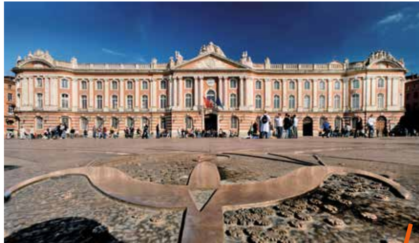
Montpellier se rendra à Toulouse, le 29 avril.

Samedi 22 avril , Toulouse prend ses quartiers, de 10h à 19h, sur l'esplanade Charles-de-Gaulle à Montpellier. L'office de tourisme de Toulouse Métropole organise un marché touristique, baptisé « Toulouse fait sa Comédie », pour vanter les atouts de la Ville rose et du pays toulousain. Plusieurs exposants originaires de la métropole de Toulouse présenteront les idées d'escapades et de loisirs offerts par ce territoire voisin, situé à deux heures de Montpellier. Des sciences, avec la Cité de l'Espace, le musée Aéroscopia, le Muséum et le Quai des Savoirs, à l'art, grâce à la Maison de la Violette, le Baron de Roquette et la Maison des Vins de Fronton, en passant par la culture, avec Terre de Pastel, le CityTour, le festival Tangospastale... L'office de tourisme de Toulouse sera également à la disposition des visiteurs pour les orienter. Cet événement, qui sera rythmé par de nombreuses animations, s'inscrit dans le cadre de la collaboration initiée depuis plusieurs années par les deux métropoles, notamment en matière touristique. En parallèle, Montpellier et ses partenaires seront présents en cœur de ville à Toulouse, le 29 avril .