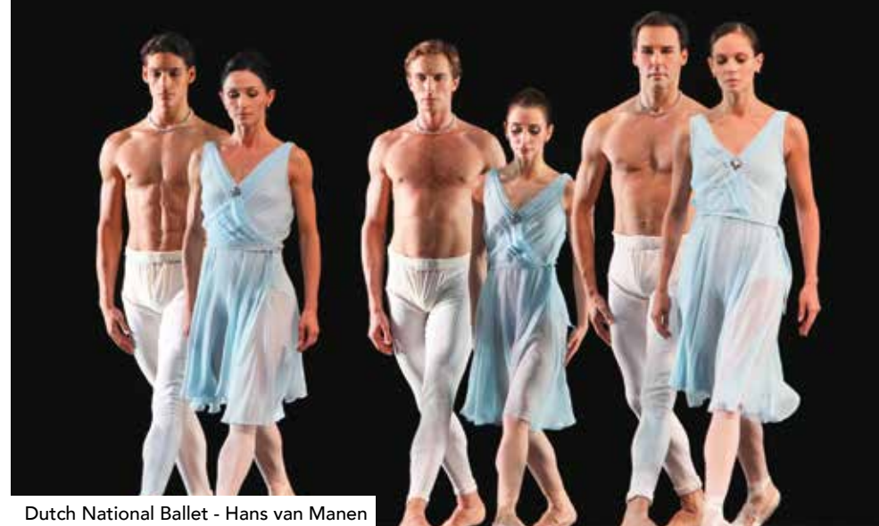
Dutch National Ballet - Hans van Manen