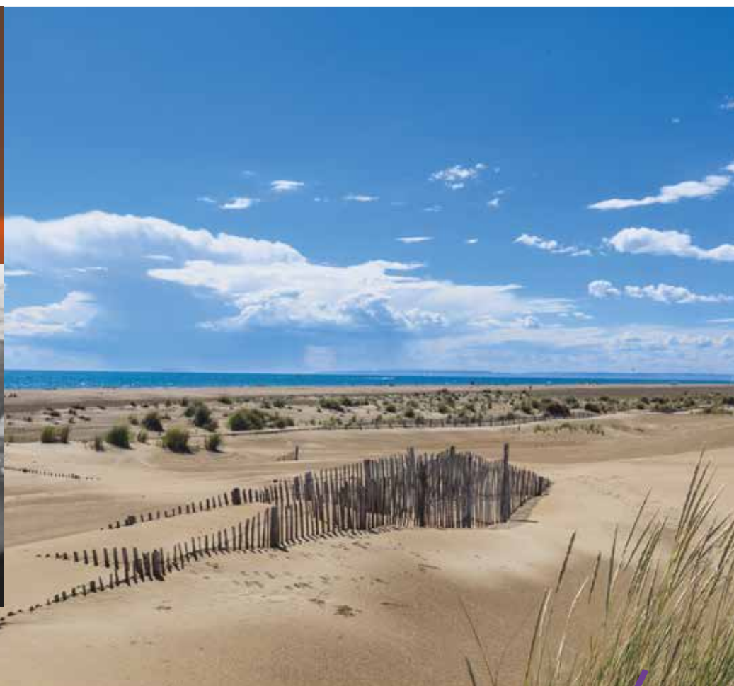
Plage magnifique qui s'étend à perte de vue bordée par ses dunes parfaitement préservées, l'Espiguette est un de mes endroits préférés. C'est un trait d'union entre le Gard et l'Hérault, mes deux « patries ».