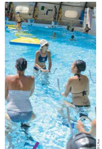
Aquabike pour les grands et structures flottantes pour les plus jeunes, il y en a pour tous les goûts !

À retrouver notamment à la piscine Suzanne Berlioux (Montpellier Près d'Arènes).