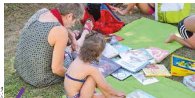
La piscine Poséidon, ainsi que Les Néréides (Lattes) et Spilliaert (Montpellier) accueillent l'opération Partir en livre.

À retrouver notamment à la piscine Poséidon (Cournonterral).