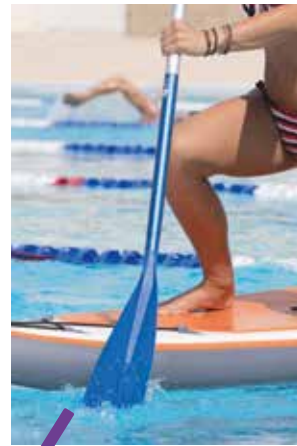
Le centre nautique Neptune accueille notamment des cours de paddle.

À retrouver au centre nautique Neptune (Montpellier Mosson).