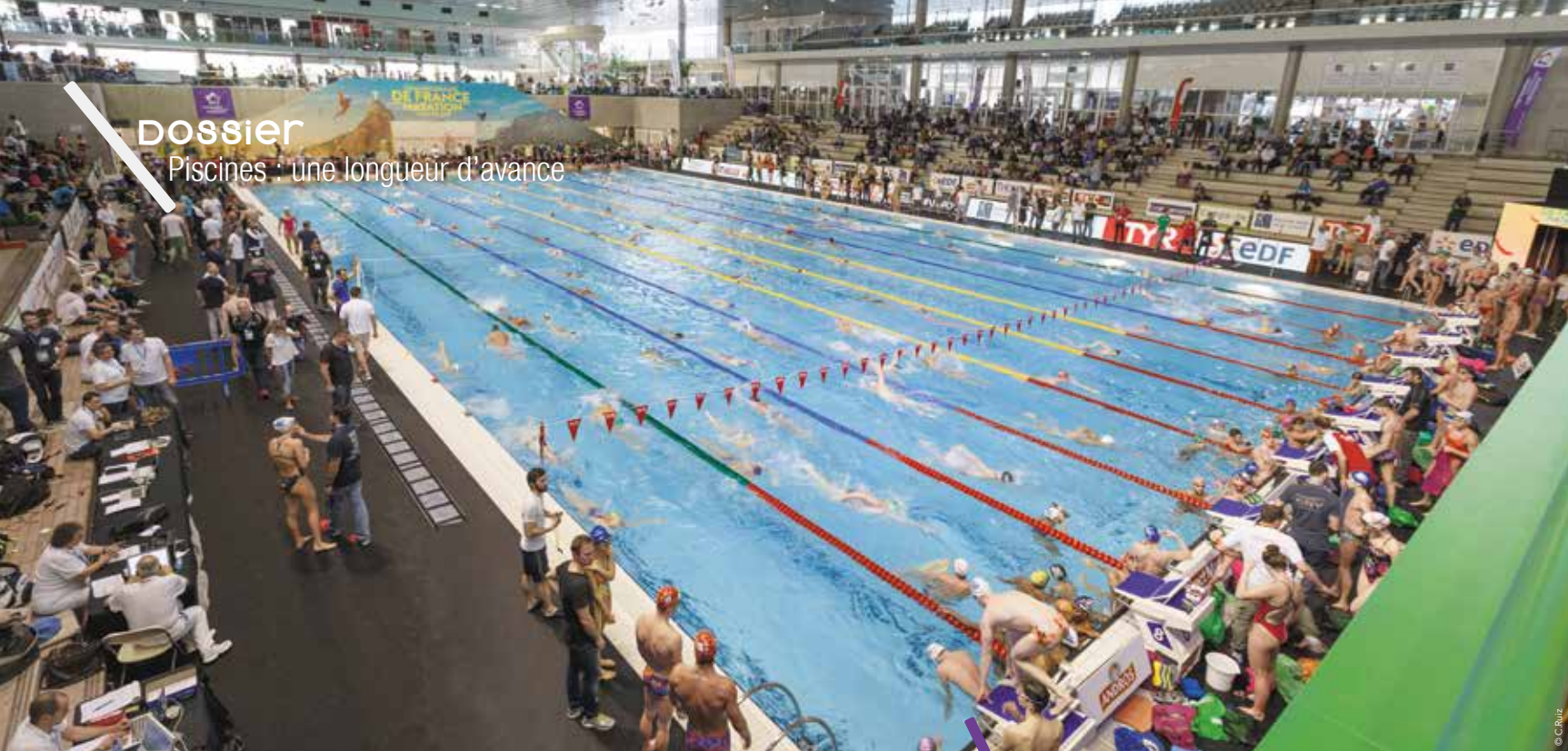
Les championnats de France de natation 2016, qualificatifs pour les Jeux olympiques de Rio, se sont déroulés à la piscine olympique d'Antigone à Montpellier.