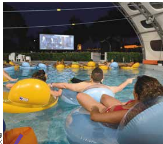
L'an dernier, la projection de La Métropole fait son cinéma à la piscine Jean Vivès a attiré de nombreux curieux.

À retrouver notamment à la piscine Jean Vivès (Montpellier Croix d'Argent).