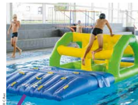
Pendant l'été, des structures gonflables sont installées sur une partie du bassin sportif.

À retrouver à la piscine Les Néréides (Lattes).