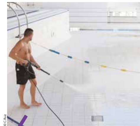
En septembre, lors de la vidange et du nettoyage, des travaux de mise en accessibilité seront effectués à la piscine olympique d'Antigone.

Pour maintenir une qualité optimale d'accueil dans ses équipements aquatiques, la Métropole consacre chaque année un budget de 900 000 euros pour leur entretien et leur mise aux normes.