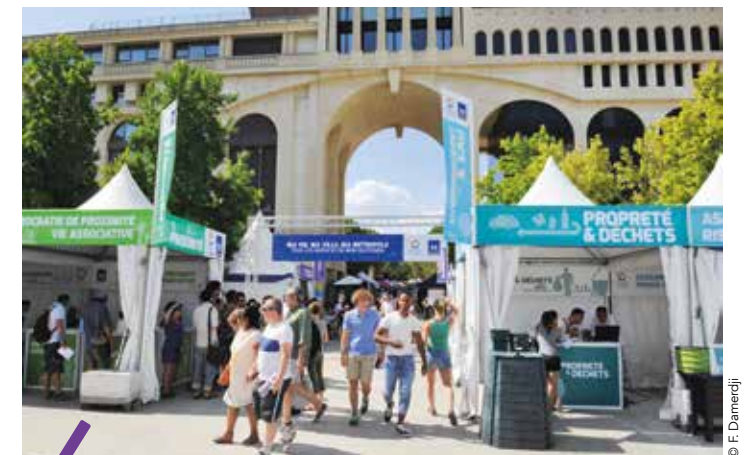
À quelques pas de l'hôtel de Métropole, le village de stands mutualisé Ville/Métropole accueillera le public.

Rendez-vous est donné le dimanche 10 septembre , de 9h à 19h, avec les 1 200 associations montpelliéraines qui présenteront leurs activités lors de la 37 e édition de l'Antigone des associations. La Métropole et la Ville de Montpellier accueillent le public dans un espace commun sous la bannière « Ma vie, ma ville, ma métropole, tous les services de mon quotidien » sur la place de Thessalie. Habitants et nouveaux arrivants pourront s'informer sur les différents services publics utiles à leur quotidien sur le village organisé en îlots thématiques : environnement/eau, culture/sport/solidarité, proximité et éducation/enfance. Une occasion également pour s'inscrire au réseau des médiathèques ou faire votre Pass'Métropole.