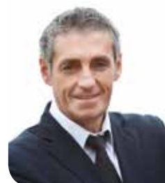
PHILIPPE SAUREL , président de Montpellier Méditerranée Métropole, maire de la Ville de Montpellier

« Un projet majeur construit étape par étape »