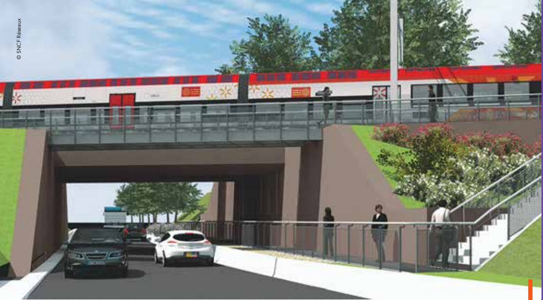
À Baillargues, le passage à niveau sera remplacé par un pont-rail passant au-dessus de la voirie d'ici septembre.