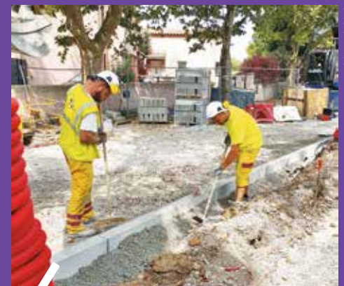
L'avenue Marcel Pagnol à Pérols profite d'un nouveau revêtement.

Entre juin et août dernier, l'avenue Marcel Pagnol a été l'objet d'importants travaux. Ses carrefours à feux ont été mis aux normes et dotés de feux de guidage pour les personnes malvoyantes. La Métropole a profité de ces interventions pour réaliser également le renouvellement d'une ancienne canalisation d'eau potable et remplacer d'autres canalisations dédiées aux eaux usées. Une fois l'ensemble des travaux terminés, la chaussée a été intégralement refaite.