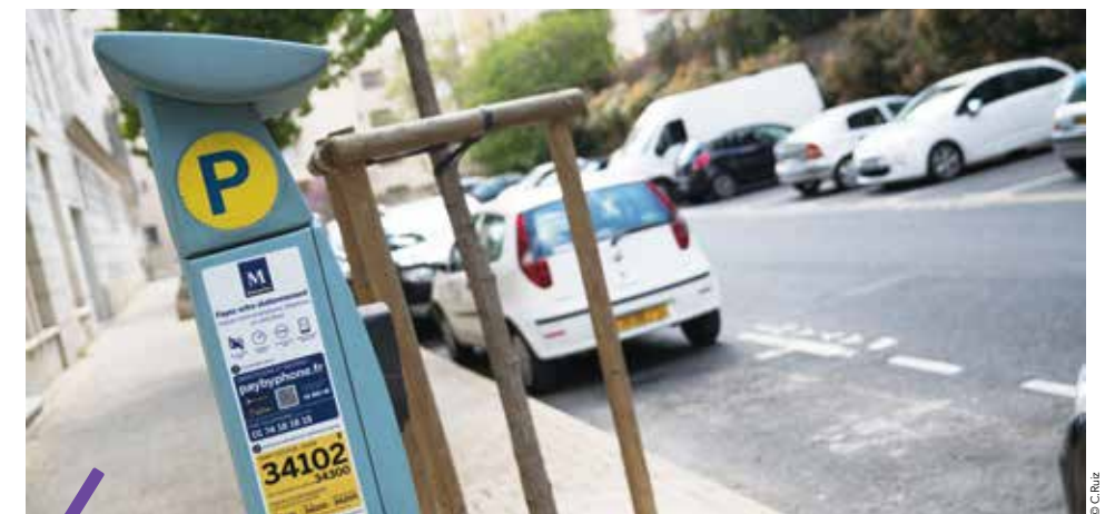
De nouvelles règles de stationnement s'appliquent à Montpellier à partir du 1 er janvier.

À partir du 1 er janvier 2018 , la réglementation du stationnement sur la voirie change à Montpellier. Principales évolutions : l'amende pénale est remplacée par un forfait post stationnement dont le montant est identique à condition que l'utilisateur s'en acquitte dans un délai de 4 jours sur Internet et dans les agences TaM. Les tarifs n'augmentent pas sur l'ensemble des zones de stationnement si la durée de stationnement n'excède pas 2 heures en zone jaune, 3 heures en zone orange et 5 heures en zone verte. Très utile, la carte Oxygène, à retirer dans les agences TaM, offre 30 minutes gratuites de stationnement pour tous chaque jour (Montpelliérains ou non) et sur toutes les zones. Pour rappel, les automobilistes arrivant à Montpellier peuvent également utiliser les 16 parkings tramway (P+tram) situés à proximité des lignes de tramway proposant plus de 5 000 places de stationnement.