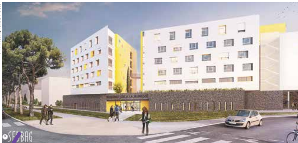
Le foyer de jeunes travailleurs « Ode à la jeunesse » s'installera sur la zone du Fenouillet à Pérols dans le cadre du projet Ode à la mer.

Dans le cadre du projet Ode à la mer, porté par la Métropole, un pôle commercial s'installera entre le centre commercial Grand Sud et le Liner à Pérols. 70 % des enseignes commerciales de la zone du Fenouillet migreront au sein de cet espace. Cela libérera des terrains sur site où se grefferont plusieurs projets immobiliers, dont le foyer de jeunes travailleurs « Ode à la jeunesse », mais aussi des logements étudiants (800 à terme), une résidence senior et un parc public de 12 hectares.