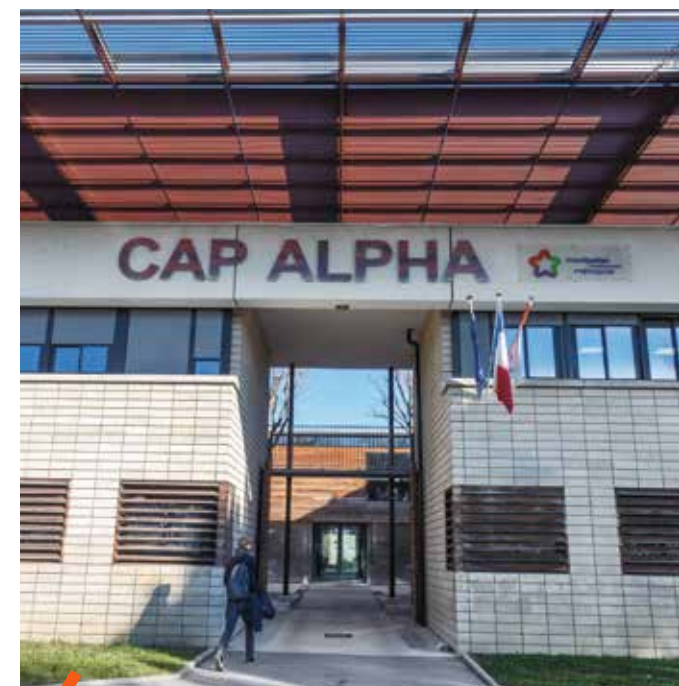
CAP ALPHA - La première pépinière du BIC à avoir vu le jour est Cap Alpha en 1987 à Clapiers. Elle héberge une vingtaine de start-up, évoluant dans la robotique, les sciences du vivant et l'électronique. Celles-ci profitent sur place de conditions idéales pour se développer avec des laboratoires, des ateliers et une offre de bureaux. Une partie de ces entreprises est directement issue de la recherche. À noter que 17 % des nouveaux créateurs accompagnés par le BIC proviennent du monde universitaire et scientifique.