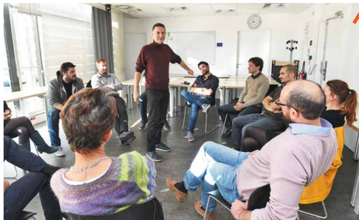
CAP OMÉGA - Une dizaine de porteurs de projets, sélectionnés par le BIC, participe à Jump'In Création. Cinq semaines de résidence à Cap Oméga pour booster leur projet d'entreprise avec des experts de l'entrepreneuriat et de l'innovation. Le BIC propose également aux start-up accompagnées de nombreuses sessions de formation sur des thèmes clés de la création d'entreprise (croissance du chiffre d'affaires, management, levée de fonds...).