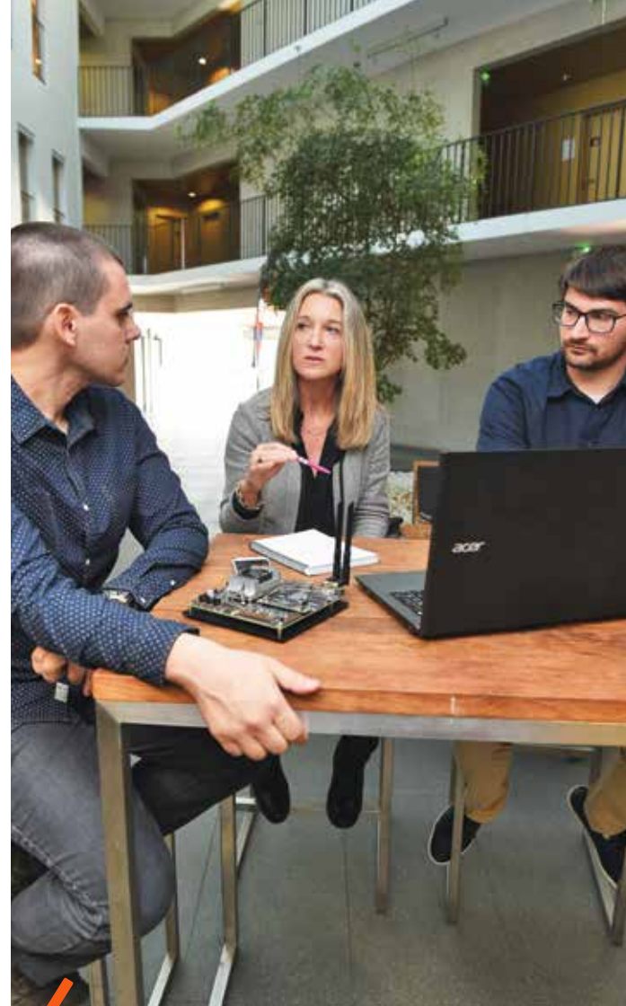
MIBI - La start-up CubOS Space est hébergée au MIBI depuis février. Elle développe des logiciels pour les nanosatellites (des modèles miniaturisés pesant jusqu'à 10 kg). Ses deux fondateurs d'origine brésilienne ont choisi de s'installer à Montpellier pour profiter du savoir-faire du BIC et lancer ainsi leur activité.

En décembre, le Business Innovation Center (BIC) de la Métropole a 30 ans. Depuis sa création en 1987, cet établissement qui accompagne la création et le développement d'entreprises innovantes sur le territoire est l'un des plus performants au monde ! Plongée dans ses coulisses pour mieux comprendre la recette de son succès.