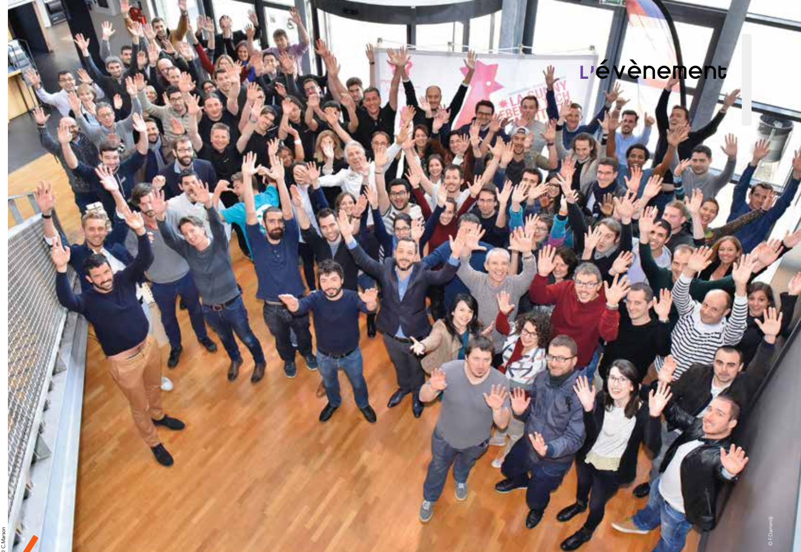
CAP OMÉGA - La pépinière Cap Oméga est une vraie ruche à entrepreneurs. Une quarantaine de start-up et leurs 300 salariés y ont élu domicile et s'y développent avant de prendre leur envol définitif. Elles profitent sur place de locaux et de services communs à des tarifs attractifs.

Elles sont nombreuses les entreprises, aujourd'hui devenues grandes, à avoir bénéficié des précieux conseils du BIC pour se lancer dans le grand bain. Des « success stories », à l'instar de Matooma (Internet des objets), désormais installée à Pérols avec ses 40 salariés et affichant plus de 800 clients dans le monde, ou d'Oceasoft (capteurs pour contrôler la chaîne du