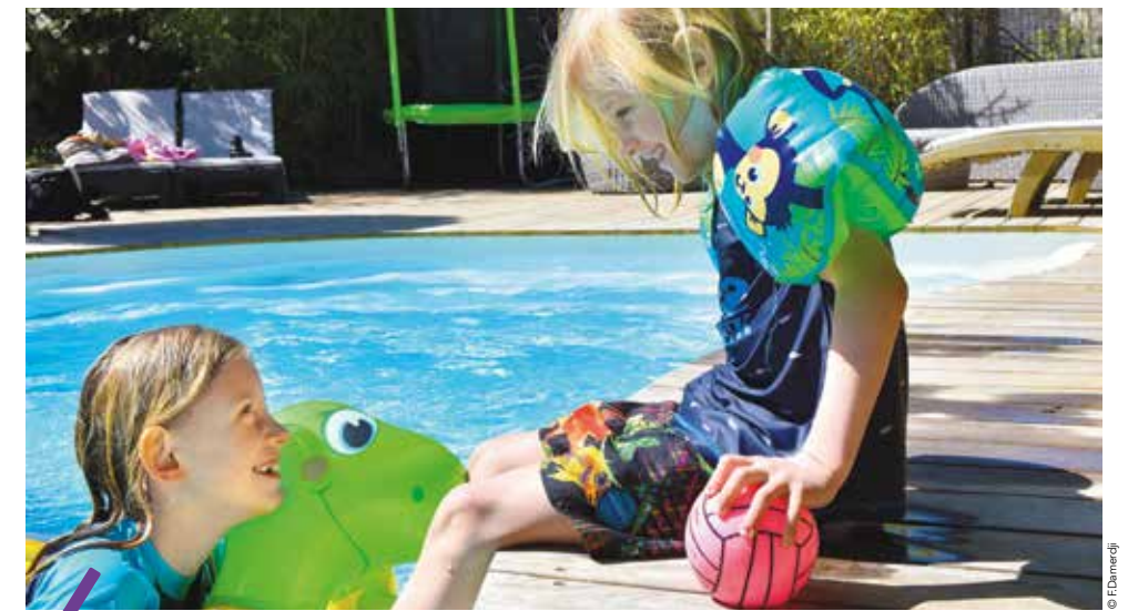
Soyez vigilants ! La noyade des jeunes est surtout constatée en piscine privée.

Avec la chaleur de la saison estivale propice à la baignade, reviennent les risques de noyade. C'est la deuxième cause de décès accidentel chez les jeunes de moins de 15 ans. La noyade des jeunes est surtout constatée en piscine privée. En 2013, année noire, 53 personnes sont mortes noyées en Languedoc-Roussillon. C'est dans ce contexte que, pour la sixième année consécutive, Montpellier Méditerranée Métropole met en place, du 30 mai au 13 juin, l'opération Prévention des noyades. « Sécuriser la baignade est un enjeu vital surtout durant la saison estivale où le danger est partout sur le littoral comme dans les piscines », explique Jean-Luc Meissonnier, vice-président de la Métropole délégué aux sports et aux traditions sportives. Avec un million d'entrées par an dans les 13 piscines du réseau, la Métropole peut ainsi toucher de nombreux usagers locaux sans oublier les touristes qui dans notre région investiront également le littoral et le bord des lacs. La mer Méditerranée, même calme, est dangereuse notamment à cause des courants qui dérivent vers le large. Attention également au choc thermique, qui cause la mort de plusieurs touristes tous les ans. Ainsi, Montpellier Méditerranée Métropole propose durant les quinze premiers jours de juin un programme