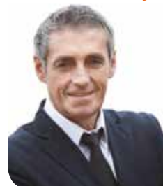
PHILIPPE SAUREL , président de Montpellier Méditerranée Métropole, maire de la Ville de Montpellier

“ Mon but est de faire une ligne accessible par le maximum de citoyens ”