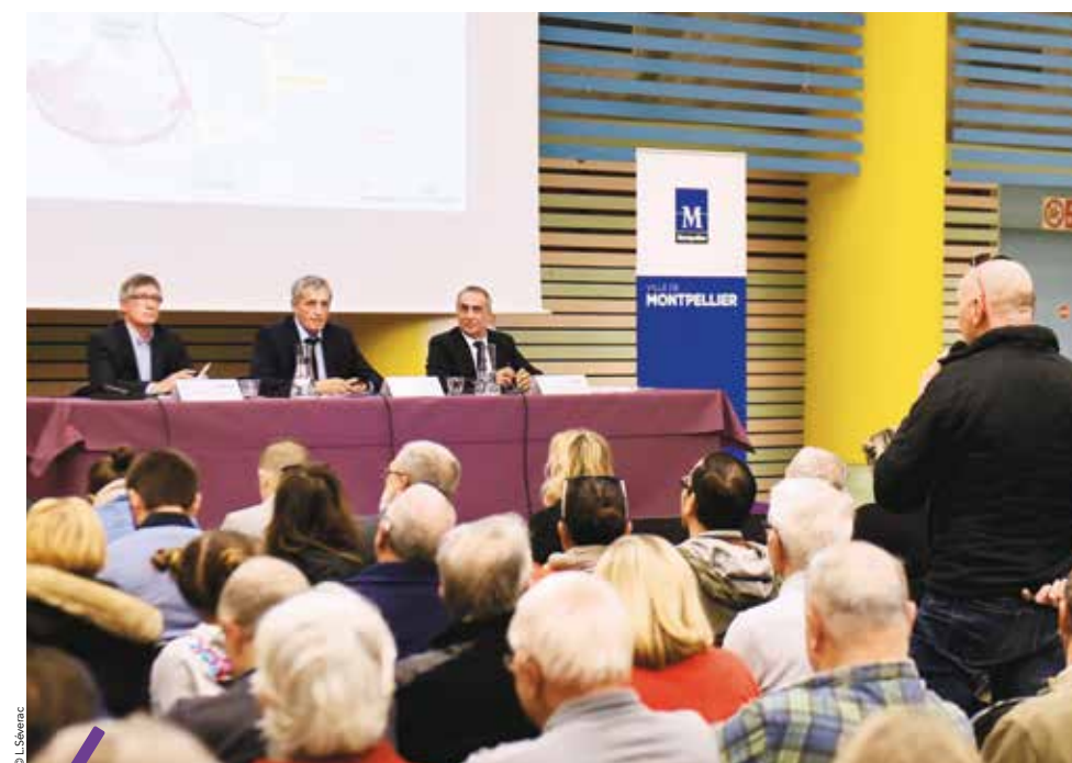
La salle Pelloutier de la Métropole était pleine lors des deux réunions publiques les 28 novembre et 4 avril.