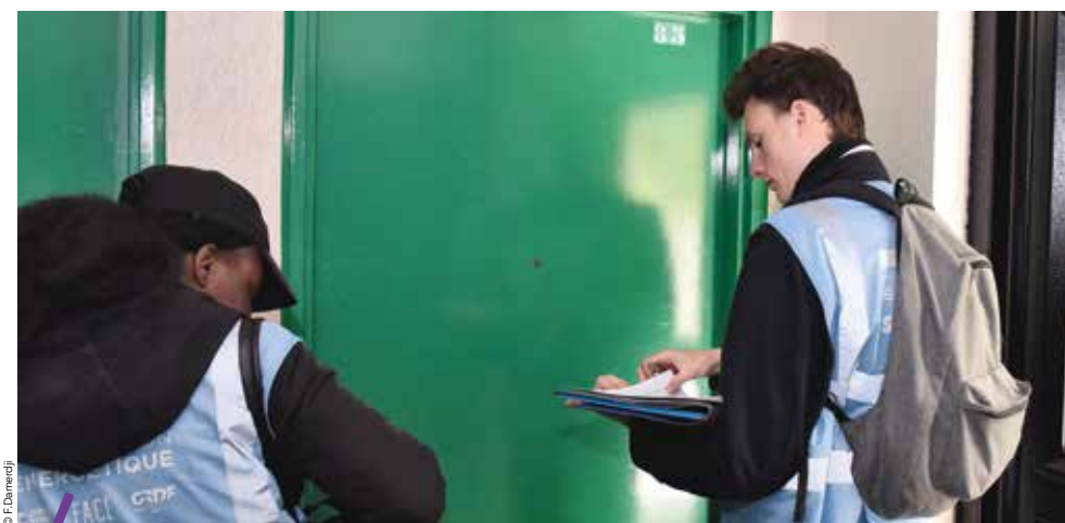
Avant d'aller sur le terrain, les volontaires ont effectué deux jours de formation sur la prévention et le tri des déchets ainsi que sur les différentes formes d'énergie disponibles.