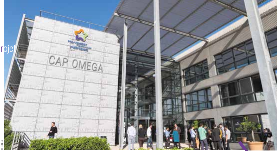
Cap Omega, pépinière d'entreprises du BIC de la Métropole, accueille de jeunes start-up et des porteurs de projet.