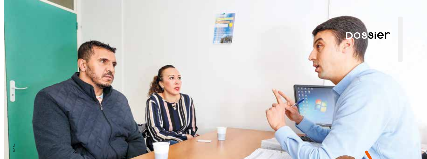
900 personnes, intéressées par l'entrepreneuriat ou ayant un projet de création, font appel chaque année à l'association Axents.