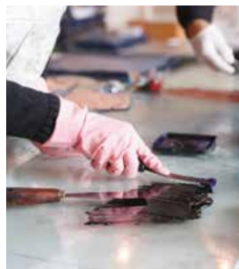
Rosaura – Impressions du Mexique. Castelnau-le-Lez Maison de la gravure maisondelagravure.eu Entrée libre