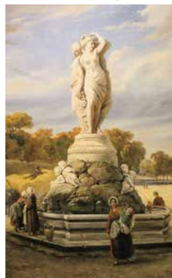
Muses et grisettes, les dames de Montpellier (XVII e – XIX e siècle). Montpellier Musée Fabre - Hôtel de Cabrières-Sabatier d'Espeyran museefabre.fr