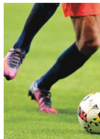
37 e journée de L1. Montpellier Stade de la Mosson mhscfoot.com