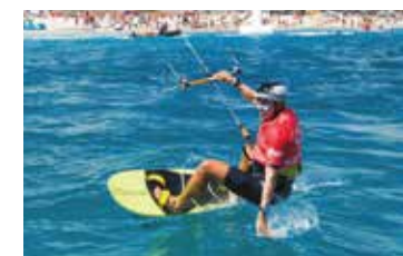
Villeneuve-lès-Maguelone Plage du Prévost festikite.net Entrée libre