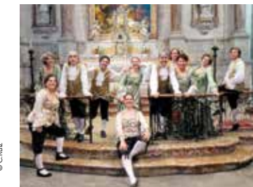
Ensemble vocal Prima Voce Montpellier Salle Pétrarque, le 19 mai à 18h Lavérune Château des Évêques, le 20 mai à 18h aporteedarts.com Participation libre

À Versailles... dans l'antichambre du roi !