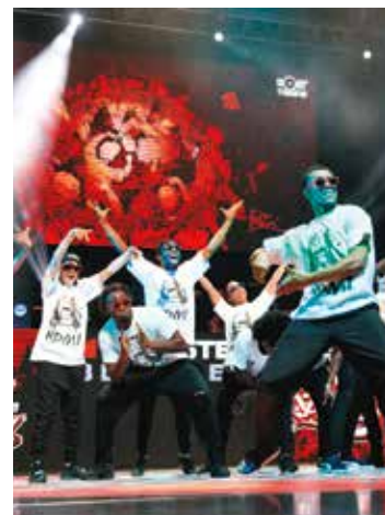
Les meilleures crews de France. Montpellier Zénith Sud botyfrance.com TARIFS de 11 € à 30 €