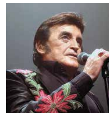
55 ans de carrière. Saint Jean de Védas Secret place à 20h toutafond.com TARIF 25 €