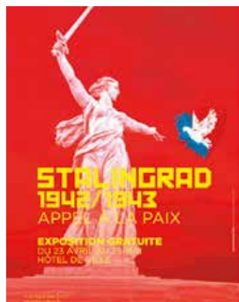
Appel à la paix Montpellier Hôtel de Ville montpellier.fr Entrée libre