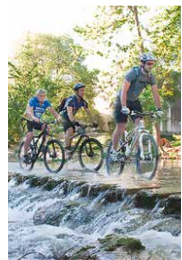
Montferrier-sur-Lez Place des Grèses à 7h30 aqueduc-montferrier.fr