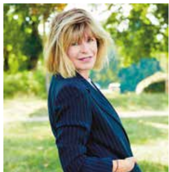
© Laurent Chahine - Albin Michel

Pour son livre Trois baisers , chez Albin Michel