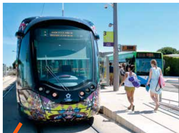
Au programme notamment, la création d'un cheminement doux entre le terminus de la ligne 3 du tramway à Pérols et la plage afin de sécuriser les déplacements des piétons et des deux-roues.

C'est la somme allouée par Montpellier Méditerranée Métropole pour la rénovation des ex-voies départementales, désormais à la charge de la collectivité, pour la période 2018-2020 dans les 31 communes du territoire. Ces investissements ont été au préalable discutés et négociés avec les maires en fonction de leurs besoins. Pour rappel, 400 km de voiries, du ressort du Département de l'Hérault, ont été transférés à la Métropole le 1 er janvier 2018.