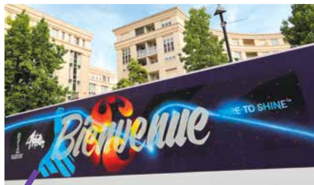
Une fresque signée Ametist et Morphem.

Pour fêter le J-365 de la Coupe du Monde Féminine 2019 de football, la FIFA, le Comité d'Organisation Local et Montpellier, une des 9 villes hôtes de cet événement international, ont commandé à Ametist et Morphem, artistes de street art reconnus, une fresque murale unique rendant hommage à la compétition et à Montpellier. Dévoilée jeudi 7 juin place de Thessalie, dans le quartier Antigone, cette fresque de 10 mètres de long se déplacera au gré des événements sportifs organisés par la Ville et la Métropole de Montpellier.