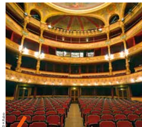
L'Opéra Orchestre national Montpellier Occitanie se produit à l'opéra Comédie et au Corum.