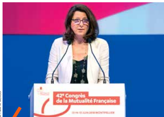
Discours de clôture du congrès de la Mutualité française par Agnès Buzyn, ministre des solidarités et de la santé, le 15 juin.