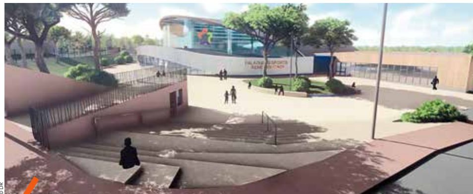
Parallèlement à la construction d'un nouveau palais des sports dans le quartier Cambacérés, l'historique palais des sports René Bougnol sera réhabilité.