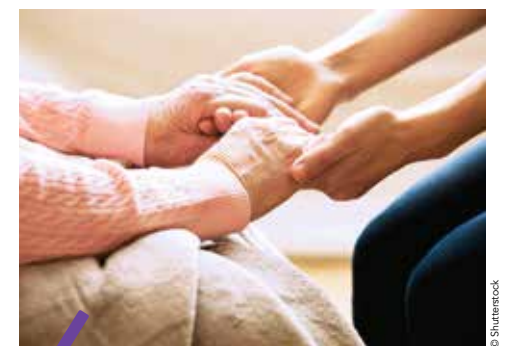
Un service de vigilance est mis en place par la Métropole et La Poste en période de canicule.

En cas de très fortes chaleurs, les personnes fragiles sont les plus exposées. La Métropole renforce son action de solidarité envers ce public avec la mise en place d'un plan d'action original en partenariat avec La Poste. En signant le contrat Vigie Canicule, la Métropole devient ainsi la première de France à permettre à toutes les communes de son territoire qui le désirent de bénéficier d'un service de vigilance assuré par les agents de La Poste. Avec des visites à domicile des personnes fragiles et/ou vulnérables, dans les 24h qui suivent l'annonce d'une alerte canicule.