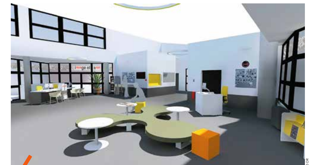
Le hall d'entrée sera complètement reconfiguré avec notamment des banques d'accueil moins importantes, l'installation de mobilier supplémentaire pour le confort des usagers et des automates de prêt.

Depuis le 11 juin, les travaux de modernisation de la médiathèque Jean-Jacques Rousseau dans le quartier Mosson à Montpellier sont engagés pour un montant de 740 000 euros. L'objectif est de rénover le hall d'entrée et de reconfigurer totalement la ludothèque. Cette médiathèque, l'une des plus anciennes du réseau métropolitain, rouvrira ses portes le 13 novembre à 12h30. Pendant les travaux, il est possible de rendre les documents empruntés dans la boîte de retour de la médiathèque Jean-Jacques Rousseau et dans les autres établissements du réseau. Afin d'améliorer le confort des usagers et les services disponibles, près de 4 millions d'euros sont investis en 2018 par la Métropole pour réaliser des travaux dans les médiathèques métropolitaines.