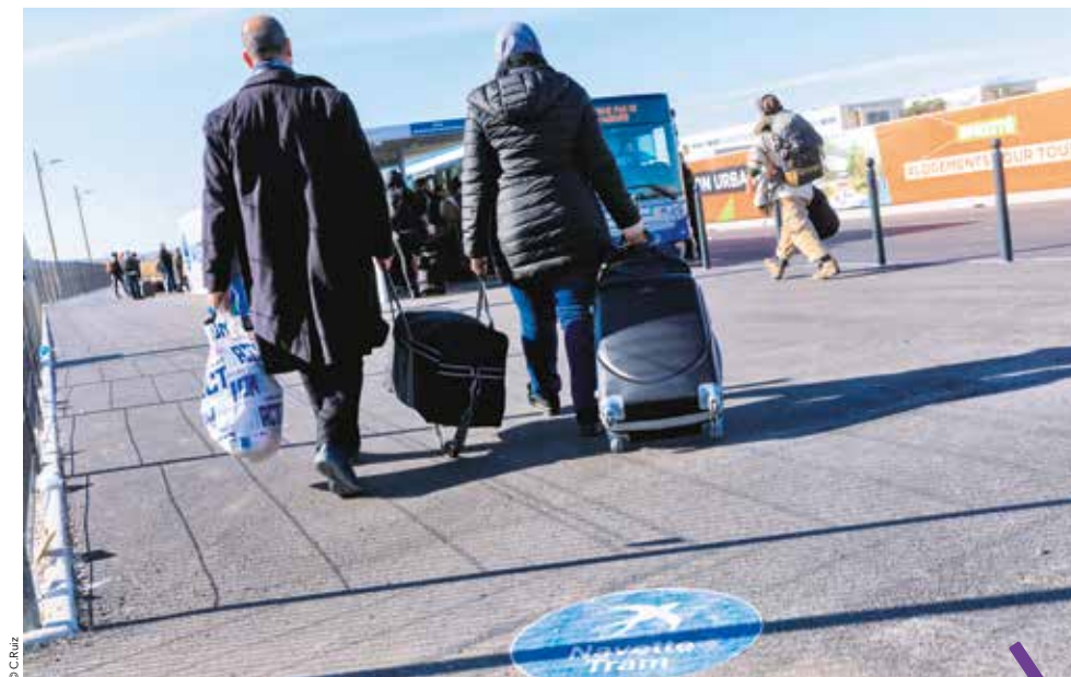
Les navettes TaM positionnées au nord du parvis facilitent le transit des usagers de la gare Montpellier Sud de France.

d'ensemble est transitoire en attendant la réalisation du pont qui supportera deux fois deux voies plus celles de l'extension de la ligne 1 de tramway vers la gare. Côté chantiers prévus cette année, certains ont commencé. C'est le cas de la création du mail entre le nouveau dépose-minute et la rue du Mas Rouge, soit en plein cœur de la ZAC Cambacérès. L'idée étant de permettre une desserte voiture autonome du nord de la gare sans alourdir le trafic au sud. Autres travaux prévus à court terme, le cours de gare, c'est-à-dire une voie en mode doux entre le lycée et la gare pour favoriser les déplacements piétons et cyclables. Au sud-est de la gare, l'ouverture en voie unique au niveau de l'enseigne Cabesto passera à double sens de circulation pour permettre une meilleure fluidité des accès sud.