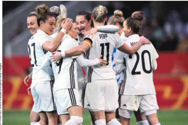
L'équipe allemande est constituée de joueuses habituées aux compétitions internationales.

Deux fois championne du Monde et championne olympique sortante, l'équipe germanique est l'une des grosses cylindrées de la compétition. Elle jouera au stade de la Mosson, lundi 17 juin, contre l'Afrique du Sud.