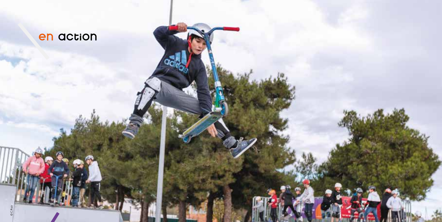
Ils sont des dizaines à chaque étape du FISE Métropole sur les skate-parks des communes comme ici à Vendargues.