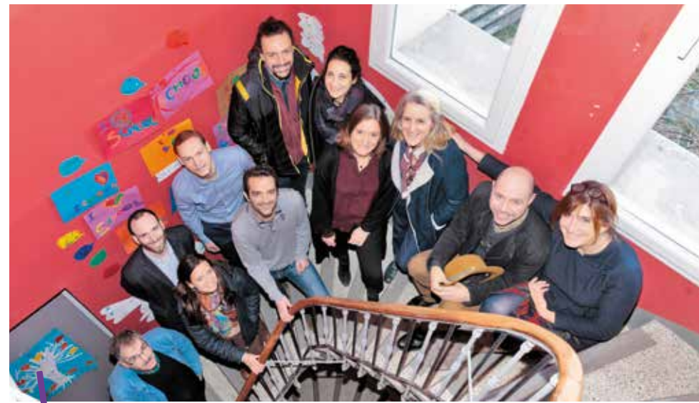
Les cinq lauréats rassemblés dans les locaux de l'école Antonia.