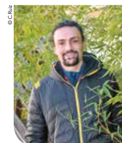
Les jardins du Lunaret (Arnaud Thurot)

S'installer comme paysan au cœur d'une exploitation maraîchère à destination pédagogique à Montpellier à côté de la base de canoë de Lavalette sur des terres de SupAgro. « L'idée, c'est de créer en exploitation individuelle une ferme un peu pilote en matière d'agroécologie.