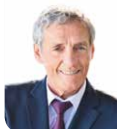
PHILIPPE SAUREL, président de Montpellier Méditerranée Métropole, maire de la Ville de Montpellier

« Une meilleure desserte des quartiers populaires »