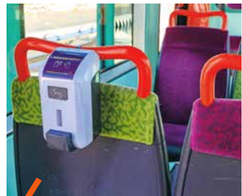
Du gel hydroalcoolique est mis à disposition.

Des mesures sanitaires exceptionnelles sont désormais appliquées dans les bus et les tramways pour protéger davantage les usagers. La première d'entre elles est le port obligatoire d'un masque de