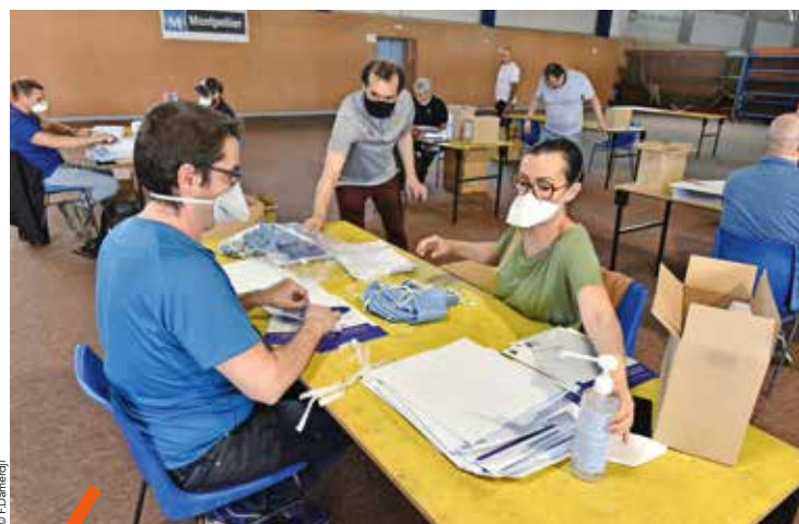
Les agents de la Métropole et de la Ville de Montpellier ont préparé un million de masques pour les habitants du territoire.

fabriquées chaque semaine localement à partir d'imprimantes 3D achetées par la Métropole pour la société Rupture Tech consulting, installée dans le village d'entreprises artisanales et de services (VEAS) Hannibal à Cournonsec. Elles ont été mises à la disposition des 31 maires de la Métropole pour protéger en priorité les personnes en contact avec le public.