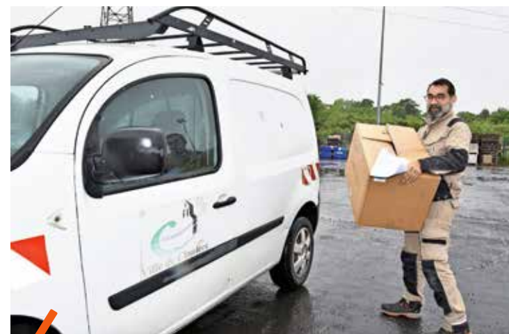
Chacune des 31 communes a récupéré son stock de masques commandés par la Métropole.