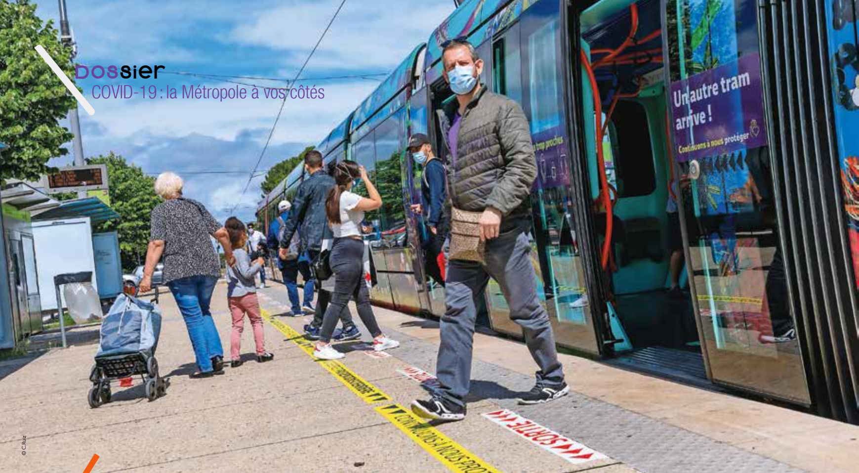
Le port du masque est obligatoire dans les tramways et les bus.