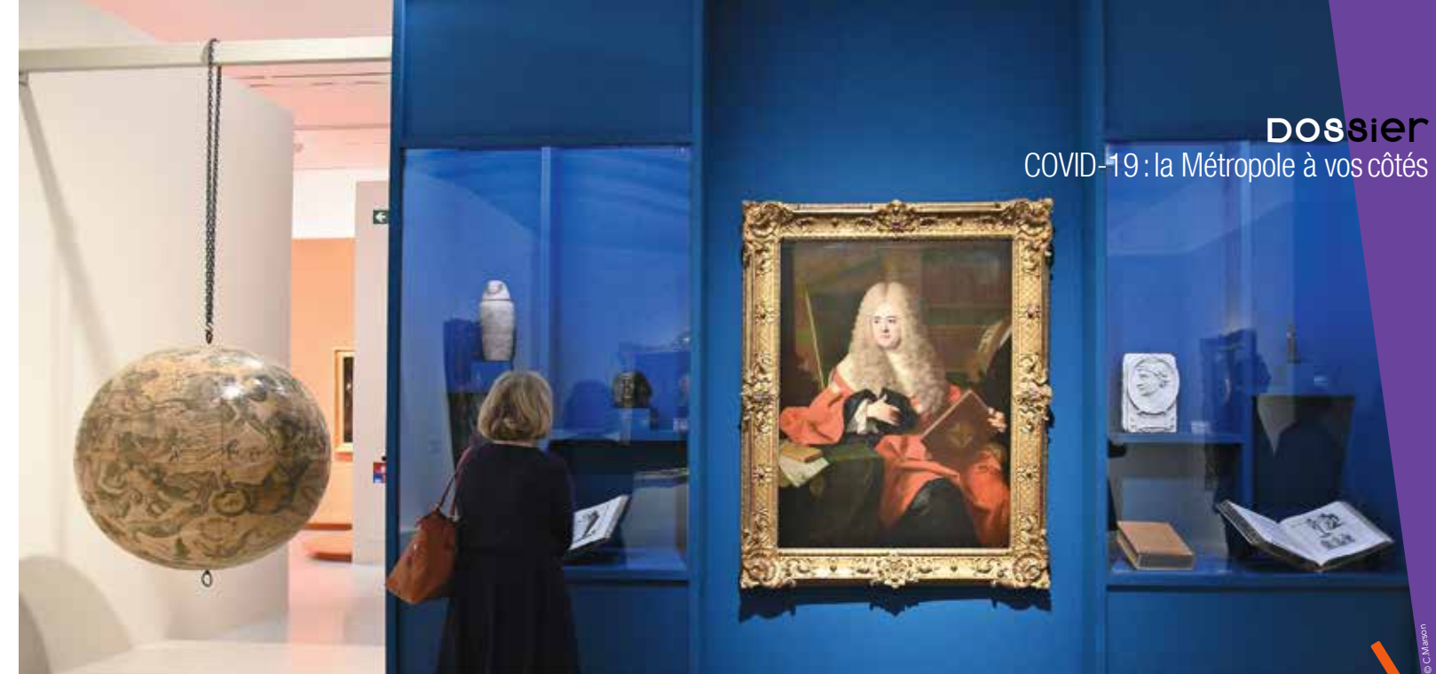
Le musée Fabre prolonge l'exposition Jean Ranc, un Montpelliérain à la cour des rois jusqu'au 28 juin.