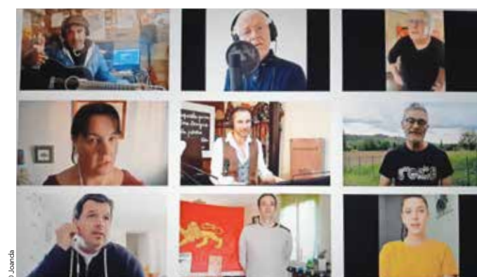
Ce clip est une mosaïque de visages de toute l'Occitanie qui fredonnent en chœur : S'il chante, qu'il chante ! Il ne chante pas pour moi, il chante pour mon amour qui est loin de moi.

facebook.com/joandaoc - instagram.com/joandaoc