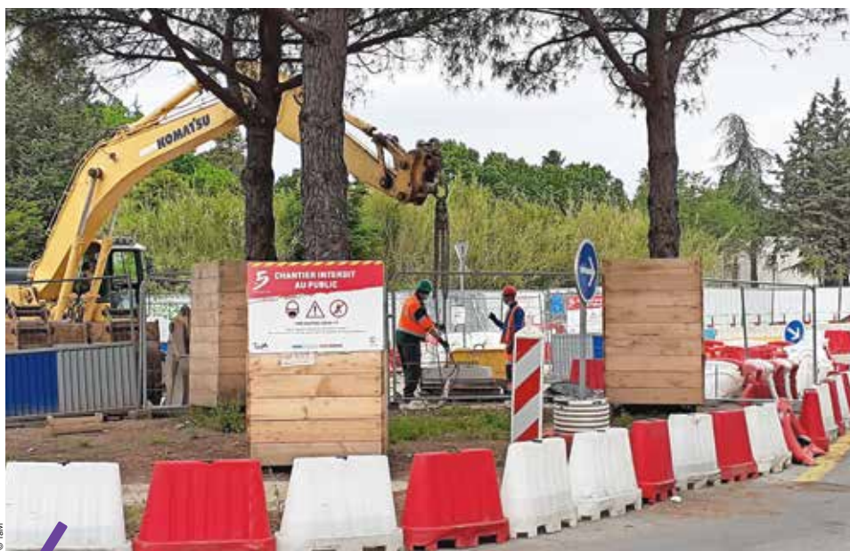
La sécurité est une priorité sur les chantiers de la ligne 5.