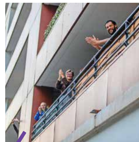
La solidarité avec les soignants s'est également manifestée par des applaudissements tous les soirs à 20h.

Les dons en argent ont été versés au Fonds Guilhem, créé pour soutenir les projets du CHU de Montpellier. Plus de 180 000 euros ont déjà été récoltés. Ils vont être utilisés pour améliorer les conditions de travail du personnel : achat de matériel pour équiper les salles de repos, création d'un espace de détente et de décompression, club de sport... Il est encore possible de faire un don dans le cadre de la collecte officielle destinée à soutenir les équipes mobilisées sur : helloasso.com/associations/fonds-de-dotation-guilhem/collectes/soutenez-les-equipes-du-chu-de-montpellier