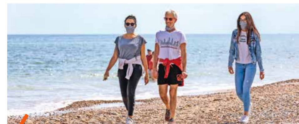
Les plages du Prévost et du Pilou à Villeneuve-lès-Maguelone sont à nouveau accessibles au public depuis le 16 mai. Mais pas pour la bronzette sur le sable ! Uniquement pour les activités dynamiques (promenade, nage, pêche, kitesurf ou paddle). L'accord préfectoral a permis une ouverture de 8h à 20h. En revanche, la plage naturelle située à l'ouest de la commune vers le site des Aresquiers et les regroupements de plus de dix personnes sont interdits. Le service du petit train n'est pas assuré. Les contrevenants s'exposent à une amende de 135 euros.