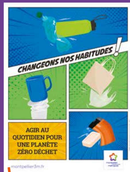
Une grande campagne de sensibilisation a été lancée lors de la semaine européenne de réduction des déchets.

« Nous allons commencer par généraliser le tri des biodéchets à la source en privilégiant le compostage et mettant en place un programme local de prévention des déchets avant de passer à la tarification incitative. Cette mesure complémentaire, et indispensable, bouclera notre politique zéro déchet, zéro gaspillage une fois seulement les équipements et les services mis à disposition, explique François Vasquez. Nos objectifs ambitieux sont dictés par l'urgence climatique. La pollution de l'air, des sols, de l'eau et le renchérissement permanent et dorénavant insupportable des coûts d'élimination des déchets ultimes ! »