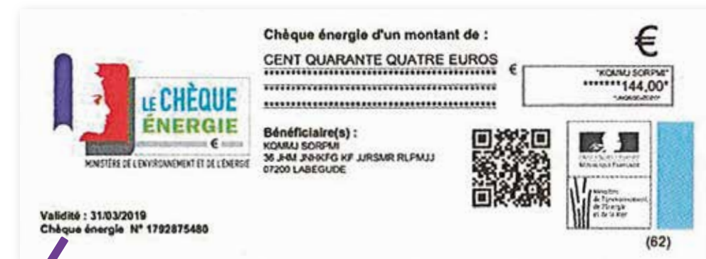
Reçu dans les boîtes aux lettres, le chèque énergie est à utiliser jusqu'au 31 mars.

De 48 à 277 euros selon sa déclaration fiscale. Comment l'utiliser ? • Le chèque est accepté par les opérateurs d'énergie et complète la facturation de votre facture. • Reçue avec le chèque énergie, l'attestation doit être envoyée ou enregistrée en ligne impérativement. Elle sert administrativement à activer les protections associées au chèque énergie.