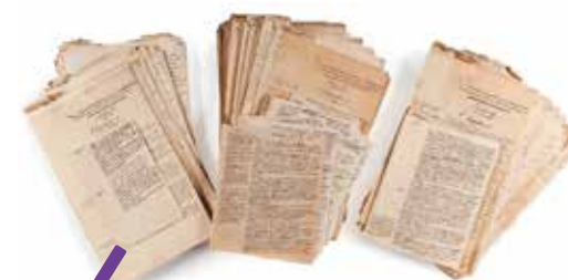
Manuscrits des Éclaircissements acquis par la Métropole le 19 novembre dernier.

Exceptionnel, le lot 655 mis à la vente le 19 novembre dernier l'était à divers titres. Par le prestige de son auteur, tout d'abord.