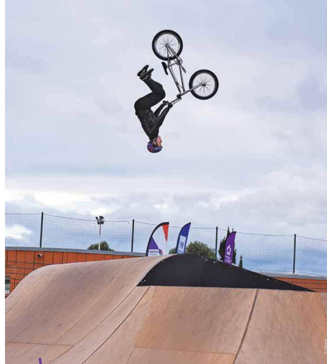
Montpellier a accueilli il y a quelques semaines les championnats de France de BMX freestyle park, une discipline désormais olympique.

La piscine olympique d'Antigone change de nom. La Métropole de Montpellier souhaitait une dénomination avec une entreprise comme cela a été fait pour le stade de rugby. C'est le groupe immobilier Angelotti qui a été retenu pour un contrat d'une durée de six ans et un montant annuel de 120 000 euros.