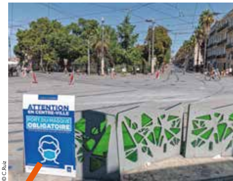
Le masque ne remplace pas les gestes barrières.