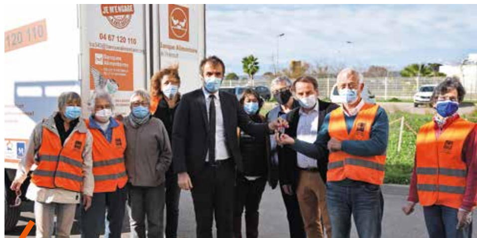
La Banque alimentaire possède désormais son premier camion pour assurer la collecte des produits frais dans les supermarchés tous les matins.