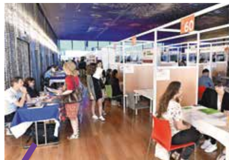
Cette année, le recrutement se fait en ligne.

Chaque année, les Rencontres pour l'emploi organisées par la Métropole et ses partenaires (1) permettent à des centaines de candidats d'avoir un contact direct avec des recruteurs et d'avancer dans son parcours professionnel.